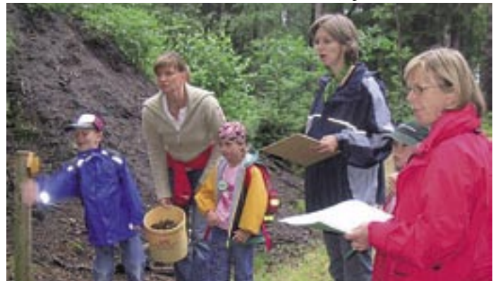
Kienapfelzielwurf: Viele Eltern beteiligten sich an den Waldjugendspielen der Grundschule Suderburg.