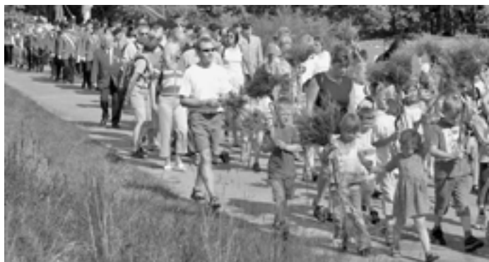
Ob beim Festumzug oder beim Schootenfegen – die Hösseringer und ihre Gäste erwartet wieder ein abwechslungsreiches Programm.