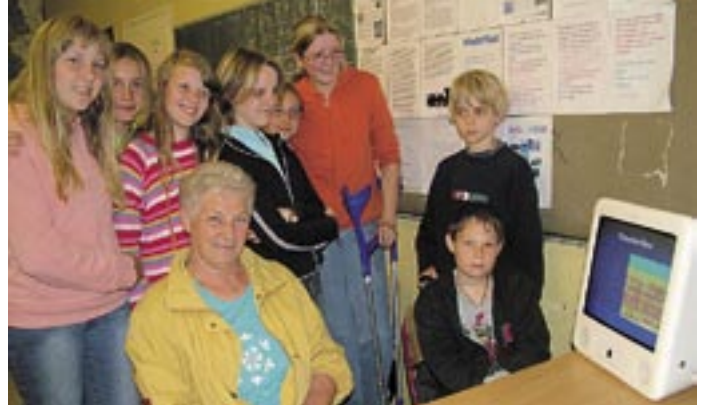
Freiherr von Knigge hätte seine Freude an ihnen gehabt: Um gutes Benehmen sicheres Auftreten zeigt es in diesem Projekt.