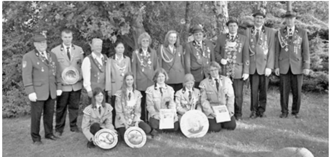
Für die Majestäten heißt es nun bald Abschied nehmen von der Königswürde.

Die Mitglieder des Schootenrings haben sich auch in diesem Jahr ein abwechslungsreiches Programm einfallen lassen, um allen Einheimischen und Gästen ein fröhliches und entspanntes Festwochenende bieten zu können. Ob beim Festumzug, bei der Tombola oder auch beim traditionellen Schootenfegen – eines ist gewiss: Es wird ein fröhliches Fest, auf das man sich schon jetzt freuen kann.