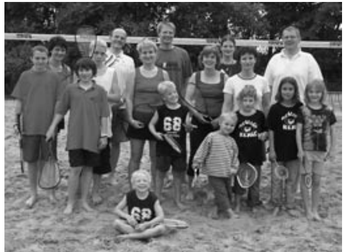
Spontanes Speedminton-Schleifchenturnier gestartet: Die Badmintonspieler des VfL Suderburg.