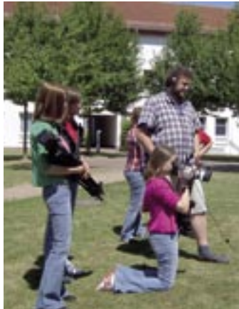
Die Jugendlichen haben Interviews geführt, Szenen nachgestellt und Informationen eingeholt. Entstanden ist eine Dokumentation „Drogen und Zivilcourage in Suderburg“.

Den Beteiligten hat es sehr viel Spaß gemacht und sie sind sehr stolz auf das, was sie geleistet haben.