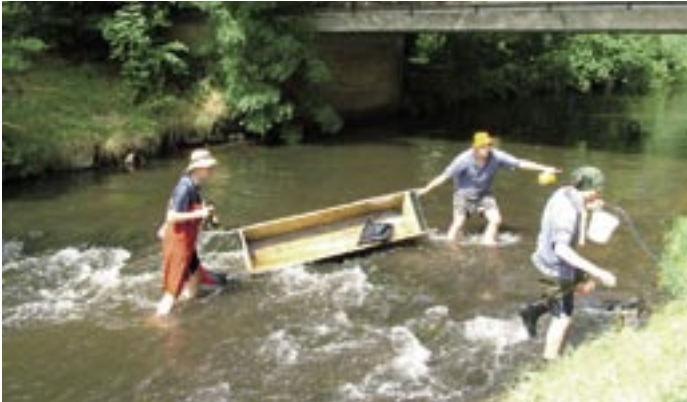
Immer wieder hieß es raus aus dem Wasser und Aufgaben lösen.

Landjugend Gerdau-Eimke lud zur 37. Brühtrogallye ein