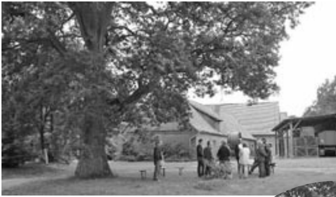
Der Graulinger Dorfplatz liegt unter einer mächtigen Eiche. Die Höfe des Ortes säumen die Dorfstraße beidseitig. Eine große Menge alter Bausubstanz hat sich erhalten. Zahlreiche alte Bäume und üppiges Grün erhöhen den Reiz des Ortes zudem.