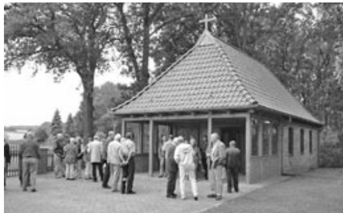
Frisch saniert: Die Friedhofskapelle.