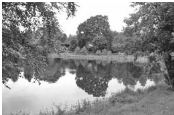
Kleinod: Der Dorfteich mit Wanderweg ringsum.

Inzwischen gibt es im Ort verschiedene Handwerksbetriebe und drei landwirtschaftliche Betriebe.