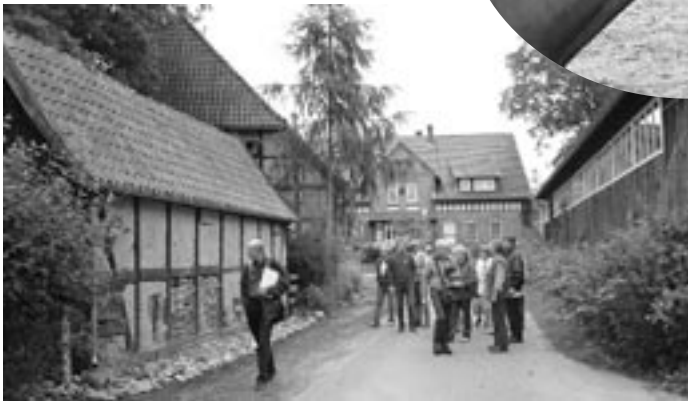
Historische Bausubstanz und einige moderne Gebäude sind in Graulingen eine reizvolle Gemeinschaft eingegangen. Am Ortsrande erstrecken sich Wiesen und Koppeln und der Lüßwald, der zwischen Graulingen und Unterlüß und damit auch zwischen den Landkreisen Uelzen und Celle liegt. Am Rande des Ortes liegt die Grotte, ein kleiner befestigter Platz, der zum Grillen, Feiern oder auch einfach nur zum gemütlichen Beisammensein einlädt. Der Verein Dorf- und Freizeitgemeinschaft Graulingen organisiert gemeinschaftliche Feste und Aktionen.