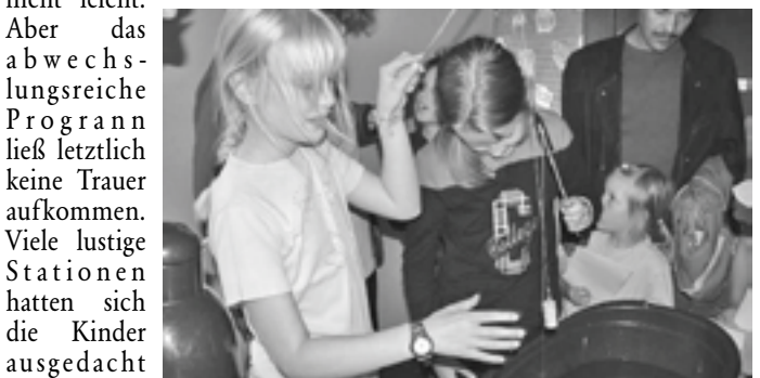
Was gibt es hier wohl zu angeln?

machen“. Ab dem kommenden Schuljahr wird es auch an der Suderburger Haupt- und Realschule eine Integrationsklasse geben. Der Abschied fiel Kindern, Lehrern und Eltern dann doch nicht leicht. Aber das abwechslungsreiche Programm ließ letztlich keine Trauer aufkommen. Viele lustige Stationen hatten sich die Kinder ausgedacht - und alle