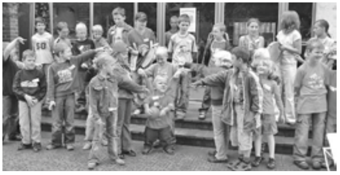
„Wer hat die Koskosnuss geklaut?“ Die Kinder erfreuten Eltern und Gäste mit einem fröhlichen Programm.

machen“. Ab dem kommenden Schuljahr wird es auch an der Suderburger Haupt- und Realschule eine Integrationsklasse geben. Der Abschied fiel Kindern, Lehrern und Eltern dann doch nicht leicht. Aber das abwechslungsreiche Programm ließ letztlich keine Trauer aufkommen. Viele lustige Stationen hatten sich die Kinder ausgedacht - und alle