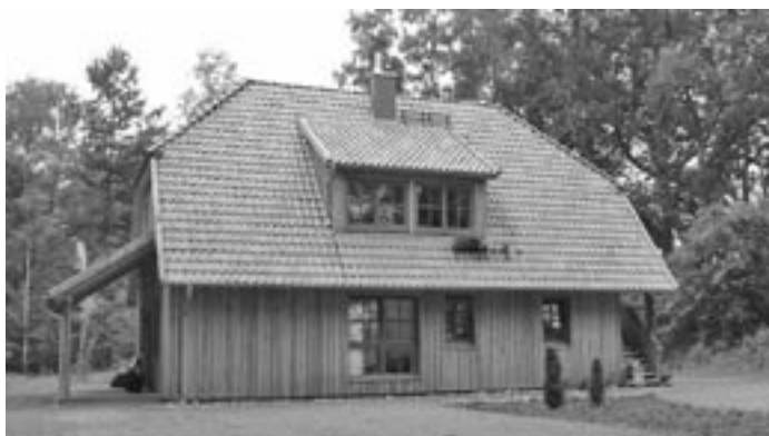
Das Wald- und Umweltzentrum (WUZ) wurde mit Mitteln der Dorferneuerung und unter erheblichen Eigenleistungen der Dorfgemeinschaft geschaffen und im vorigen Jahr eröffnet.