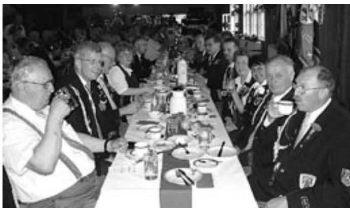
Ein Fass Bier vom scheidenden König gabs beim Königsfrühstück.