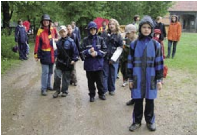
Trotz Dauerregens hatten die Kinder viel Spaß und waren enttäuscht über den Abbruch der Waldjugendspiele. Doch dann kam die freudige Nachricht: Die Spiele werden wiederholt. Also ging es ein zweites Mal auf Pirsch in den Schootenwald. Mit den Regenjacken im Gepäck, denn man kann ja nie vorsichtig genug sein.