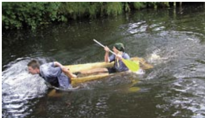
„Nun mach schon, ich rudere hier wie der Teufel!“ Egal, die Notration ist aufgeweicht und die Zöpfe sind auch schon nass.

Mit der Eleganz haperte es zwar mitunter, „doch durch ist durch“ hieß es beim „Tigersprung“. Hauptsache, die Ausrüstung war fest vertäut und überstand diese und alle weiteren fünf Stationen der Brühtrogallye auf und in der Gerdau.