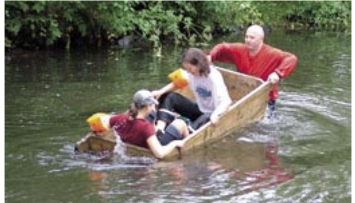
Da blieb kein Auge - und die Klamotten schon gar nicht - trocken.