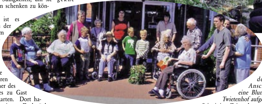
Eifrig: Die Bewohner des Twietenhofes bastelten gemeinsam mit den Kindergartenkindern. Anschließend wurde eine Blumensäule vor dem Twietenhof aufgestellt.

Seit einiger Zeit stehen regelmäßige Besuche in beiden Häusern auf dem Programm.