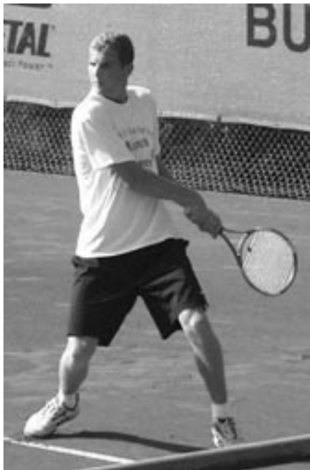
Während der Bezirksmeisterschaft in Uelzen.

Kristian: Ich muss schauen was jetzt kommt. Abi-Prüfung ist angesagt. Dann Wehrpflicht ableisten und dann Berufsausbildung. Vielleicht bietet sich in guten Turnieren noch die Möglichkeit zu prüfen was geht. Dampf dafür habe ich! ab