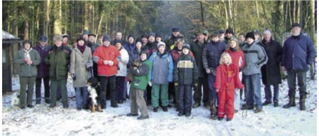
Gut 40 Dreilinger waren dabei: Jubiläumsgrenzbegehen durch den Klosterforst.

Eine altbekannte Route stand in diesem Jahr auf dem Pro-