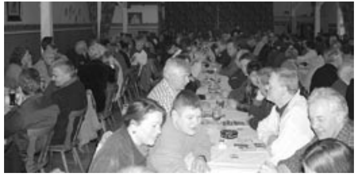
Volles Haus: Auch in diesem Jahr war das Gasthaus Müller zur traditionellen Dorfrechnung wieder bis auf den letzten Platz besetzt.

Um zu sparen, wird die Straßenbeleuchtung seit einiger Zeit reduziert: Im Winter brennen die Lampen nur noch bis 23 Uhr, in den Sommermonaten soll künftig ganz darauf verzichtet werden. 31.500 Euro hat die Gemeinde im vorigen Jahr für die Beleuchtung ausgegeben, wegen steigender Energiepreise wird mit einer Steigerung um zehn Prozent gerechnet. Der im vorigen Jahr begonnene Ausbau des Postwesens wird – wenn Zuschüsse