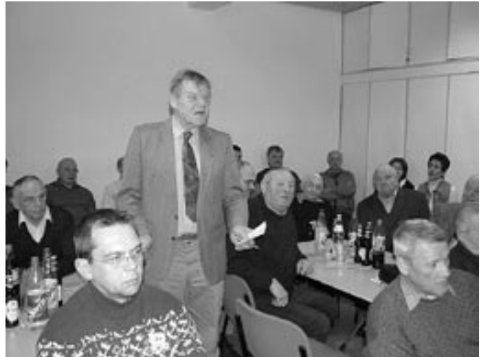
Jugendraum neben Kleingartenidyll: In den Herbstferien war es vorbei mit der Harmonie.