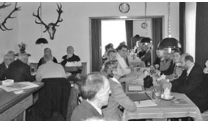
Volles Haus: Im Gasthaus Dehrmann fühlten sich die Gäste wohl.

Übrigens wird in Bahnsen am Tage der Bauernrechnung traditionell auch das Jagdgeld ausgezahlt. Und nach all den Zahlen und den vielen Worten freuten sich die Bahnsener dann am Abend auf ein gutes Essen und das Tanzvergnügen. Rund 80 Gäste waren gekommen – und sie feierten bis in den frühen Morgen.