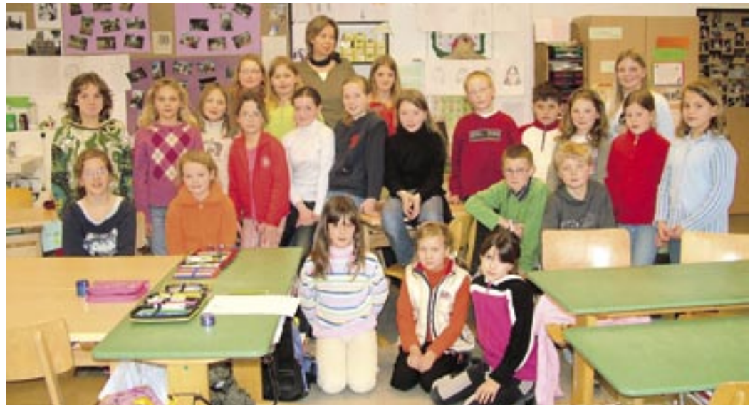
Vorbereitungen: Die Kinder des Kurses „Künstlerisches Gestalten bereiten die Kulissen, den Hintergrund und die Kostüme für das Musical „Drei Wünsche für die Fee“ vor.