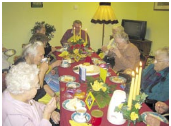
Monatsgeburtstagsfeier: Mit einer großen Torte und einem abwechslungsreichen Programm feierten die Jubilare im Twietenhof auch im Januar wieder gemeinsam Geburtstag.

„Demenzkranken können nicht mehr lernen, sich an die Umwelt anzupassen. Darum müssen alle Mitarbeiter lernen, sich auf die Bedürfnisse dieser Menschen einzulassen. Das erfordert ein Umdenken für alle Beteiligten“, so die Therapeutin. „Wir lernen mit unseren Bewohnern. Und wir haben noch viel vor.“ rve/ck