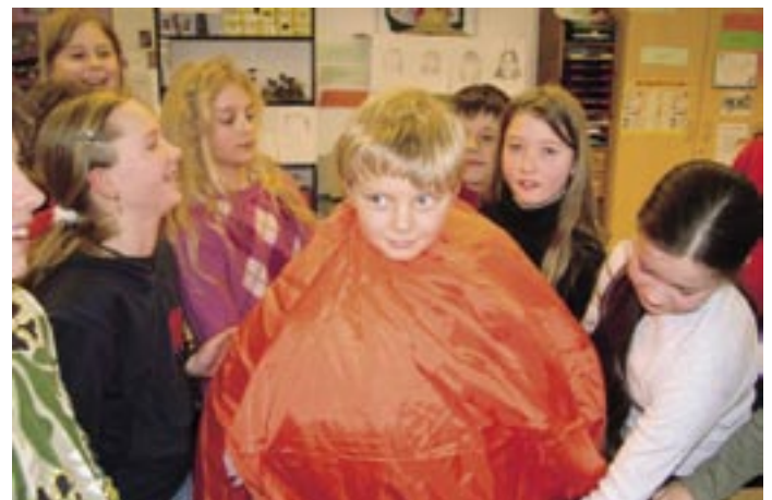
Spaß herrschte bei den ersten Anproben.

Vorgestellt: Menschen aus unserer Region > Seite 16