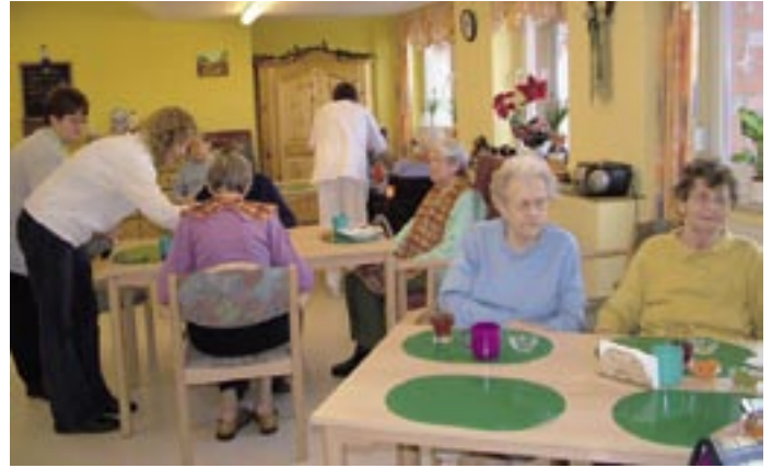
Erfolgserlebnisse haben, sich wertvoll und nützlich fühlen – das ist ein wichtiger Baustein in der Betreuung Demenzkranker.