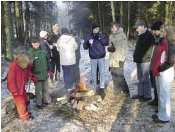
Das tat gut: Bei Niehus Brück gab es Vesper und wer mochte, konnte sich am Lagerfeuer aufwärmen.

Geespert wurde nicht weit von Niehus Brück, dort wo einst das Vorwerk des Rittergutes Niebeck stand. Heute erinnern nur noch die Brücke über den Heisebach und der alte Fischteich an den früheren Wirtschaftshof Neuhaus. ck