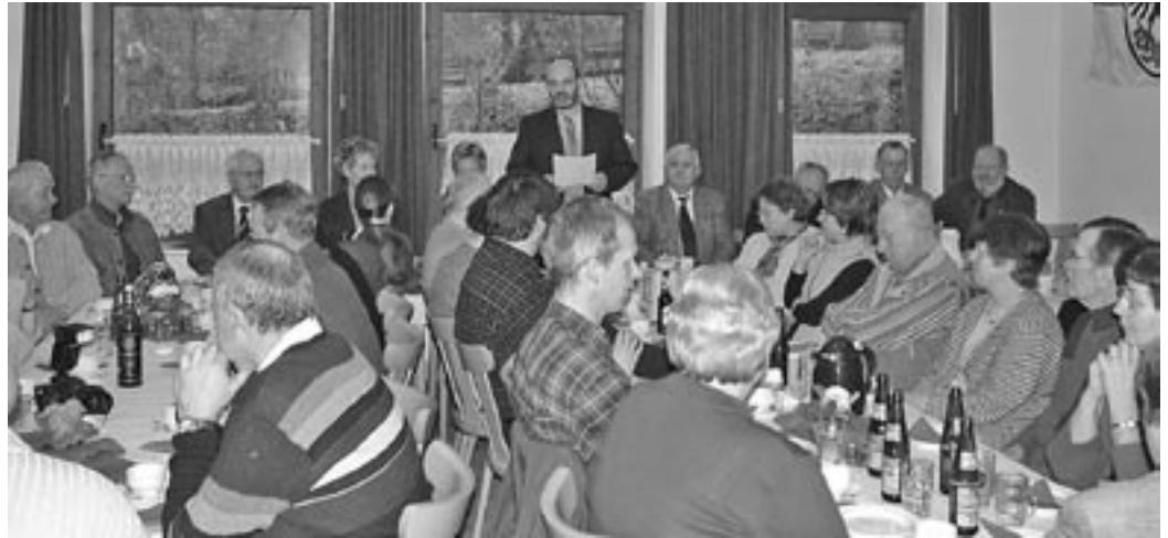
Kein Platz blieb frei im Feuerwehrhaus Räber: Rat und Verwaltung hatten zur Bauernrechnung geladen.

Derzeit wird eine Chronik von Räber erstellt. Die Finanzierung, sei jedoch schwierig, so Depner, der gleichzeitig um historische Fotos von Grundstücken, Veranstaltungen oder Straßenansichten