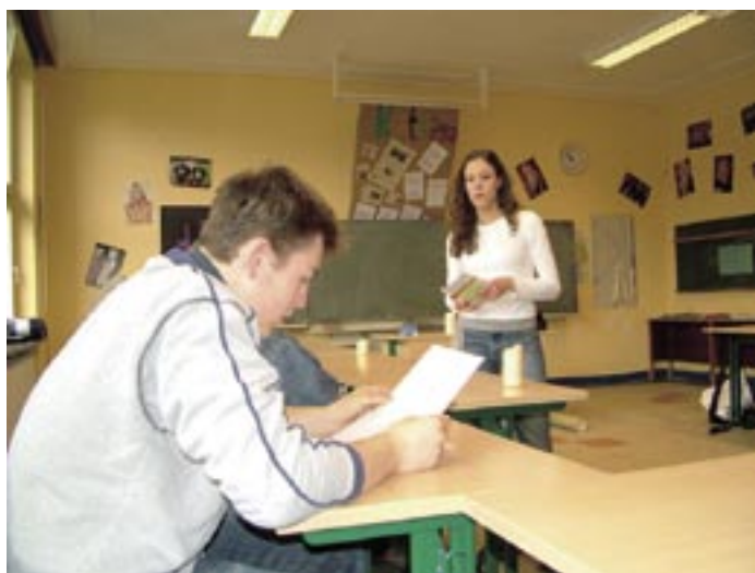
Hautnah: Nicht bloß stumme Zuschauer sind die Schüler. Sie werden einbezogen in das Geschehen, fast so, als ob sie die Geschichte selbst miterlebt hätten.