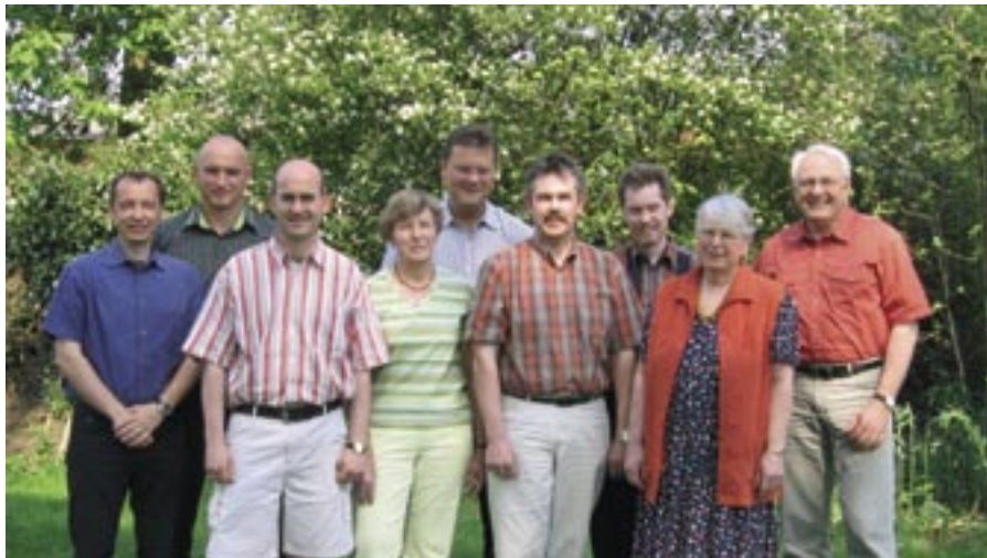
Das neu gewählte Team setzt auf ein modernes, effektives und freundliches „Miteinander Wirken“ im „Wirtschaftsraum Samtgemeinde Suderburg“ und kooperiert und arbeitet gut mit ansässigen Wirtschaftsbetrieben, Kommune und Tourismusverein Suderburger Land zusammen.