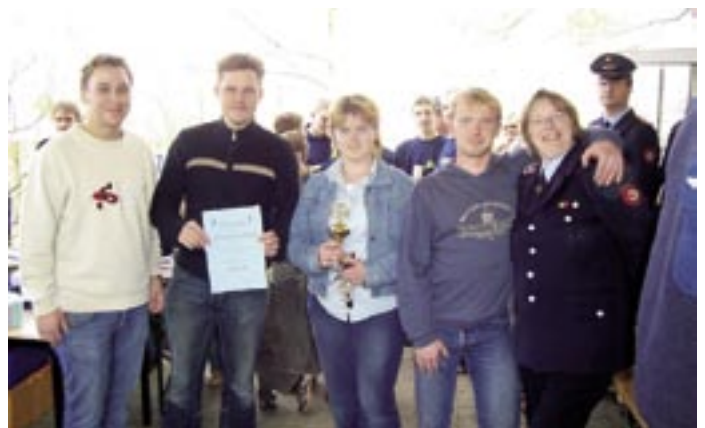
Die Jugendfeuerwehr aus Eimke durfte sich über den 2. Platz freuen.