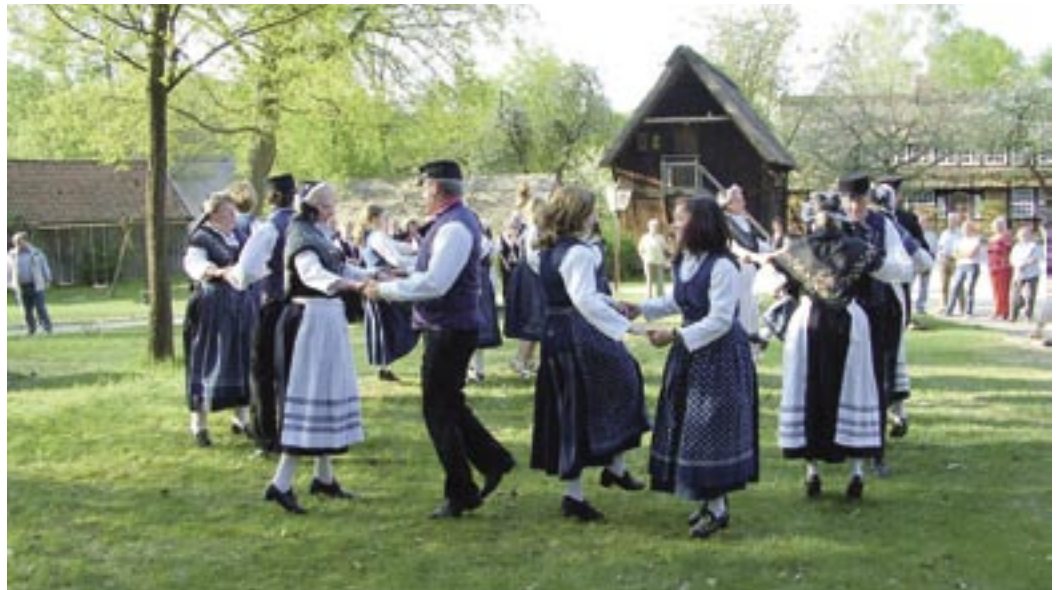
„20 Jahre Plattdütsch am Kamin“: Die Plattsnackers feierten ein fröhliches Jubiläumsfest in Hösseringen.

Also: Den Termin am 7. Juni um 11 Uhr bereits jetzt vormerken.