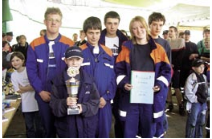
Durften den Pokal behalten: Die Kameraden der Dreilinger Wehr belegten den ersten Platz.