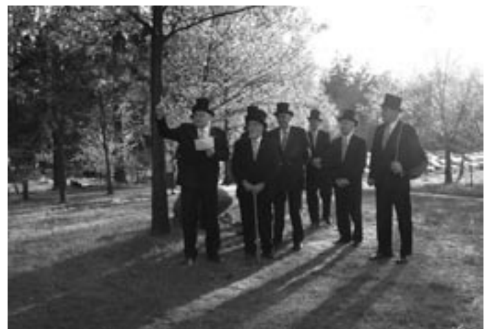
Die Plattsnackers nehmen es genau: Alles muss seine Richtigkeit haben.