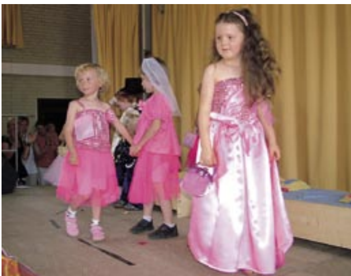
Die Kostüme haben die Kinder selbst entworfen und gemeinsam mit den Eltern genäht.