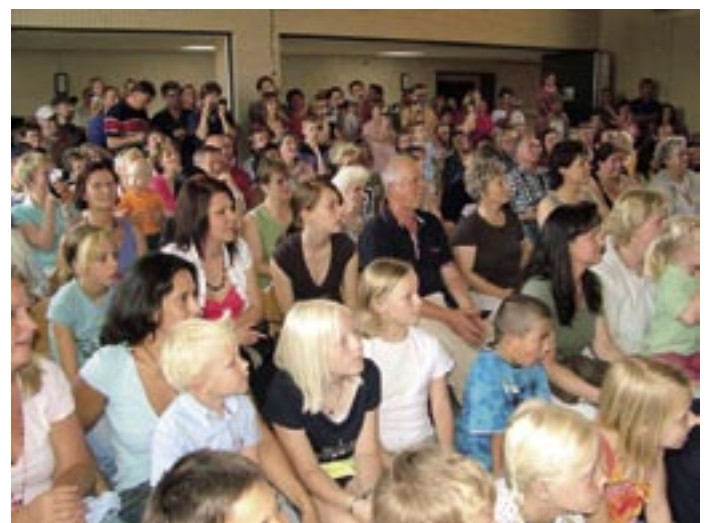
Der Saal bot nicht genug Platz für die vielen Gäste, die bei der Modenschau dabei sein wollten.