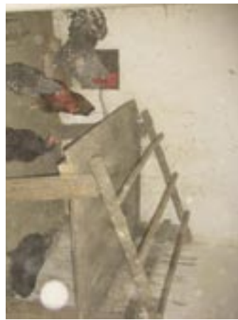
Im Kötnerhaus finden die Hühner ihr neues Zuhause...