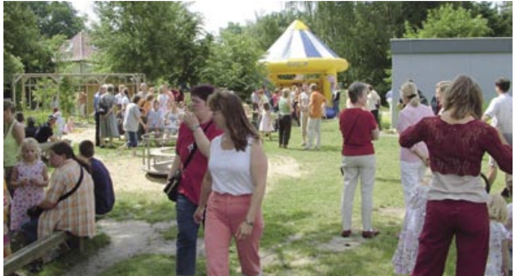
Viele Eltern und Gäste waren gekommen, um gemeinsam mit den Kindern und dem Team des DRK Kindergartens Geburtstag zu feiern.

Dazu haben sich die Kinder, Eltern und Erzieher viel einfallen lassen. Den ganzen Tag über gab es Aufführungen der Kinder mit