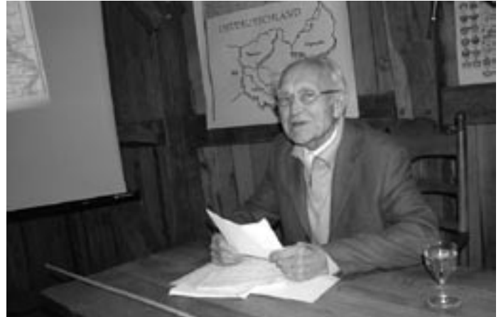
Bis auf den letzten Platz besetzt: Erzählabend im Bohlser Speicher.