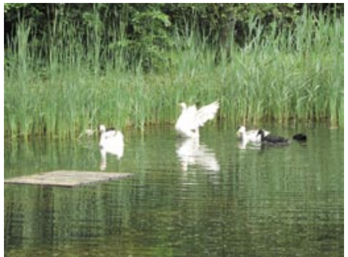
„Lebendiges Museum“ – damit dies möglich ist, spenden die Mitglieder der Geflügelzuchtvereine im Landkreis Uelzen in jedem Jahr Tiere.