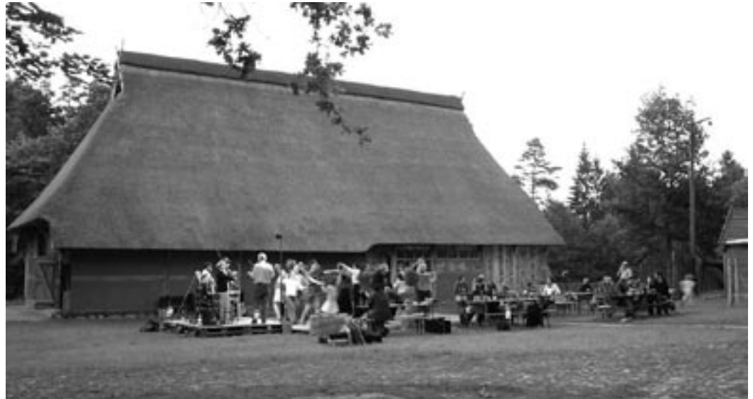
Tanz vor historischer Kulisse: Bis in die Nacht hinein wurde musiziert und getanzt.

Es ist das erste Mal, dass ein solcher Workshop im Museumsdorf Hösseringen stattgefunden hat – und auch für die Organisationen war es eine Premiere. „Wir wollten ermöglichen, dass sich Leute aus vielen Regionen treffen und gemeinsam musizieren