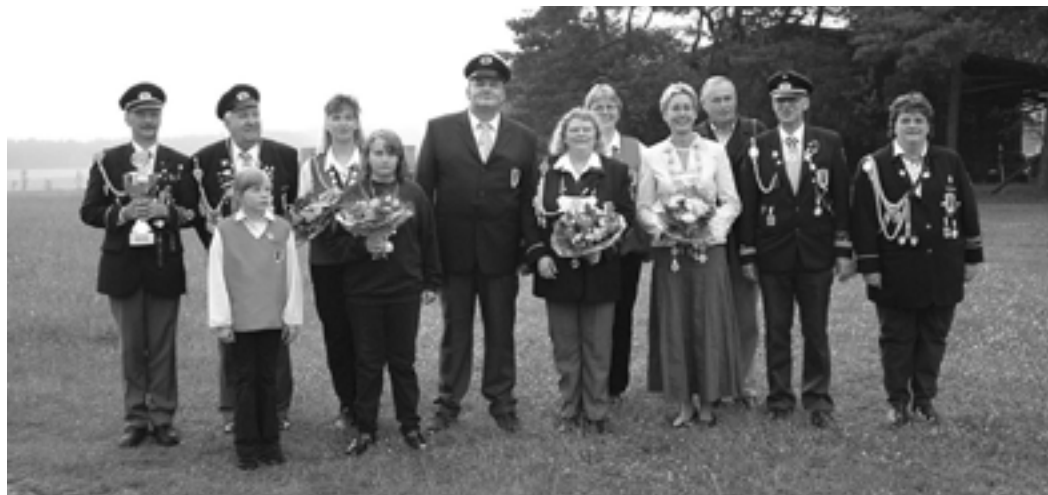
Fototermin: Die neuen Majestäten der Kyffhäuser Kameradschaft Suderburg.