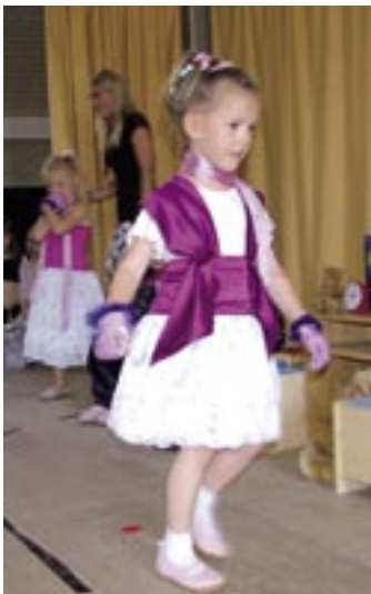
Modenschau, Zirkus und vielen anderen Höhepunkten. Und

auch sonst war viel geboten: Die Hüpfburg war da, es wurde zu verschiedenen Spielen eingeladen und natürlich gab es auch viele Leckereien. Die Jugendfeuerwehr war auch dabei und sorgte für Gegrilltes und Getränke.