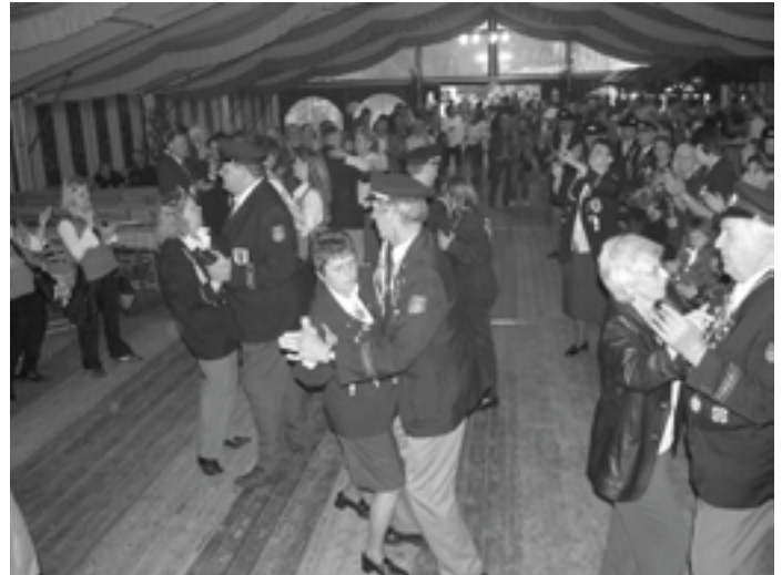
An den Abenden wurde zum Tanzvergnügen geladen.