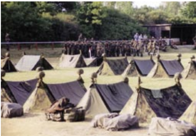
2000: Biwaklager der Patenkompanie auf den Sportplatz.