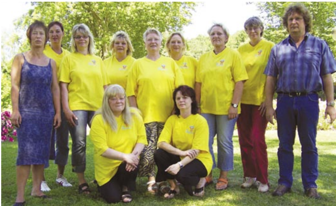
diese Mitarbeiter sind schon über 10 Jahre im gesamten Landkreis für das Pflegeteam tätig