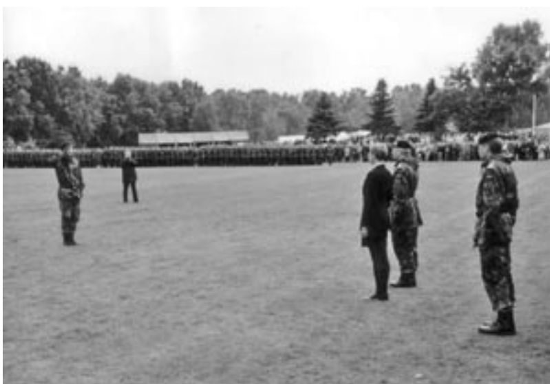
2001: Eines der zahlreichen Gelöbnisse auf dem Sportgelände von Hösseringen.

Kaum zu glauben, dass inzwischen schon 30 Jahre vergangen sind, seit die Patenschaftsurkunden ausgetauscht wurden. Aus diesem Anlass laden die Hösseringer Bürger und die Vertreter der Patenkompanie herzlich zu einer Jubiläumswoche vom 18. bis zum 24. September nach Hösseringen ein.