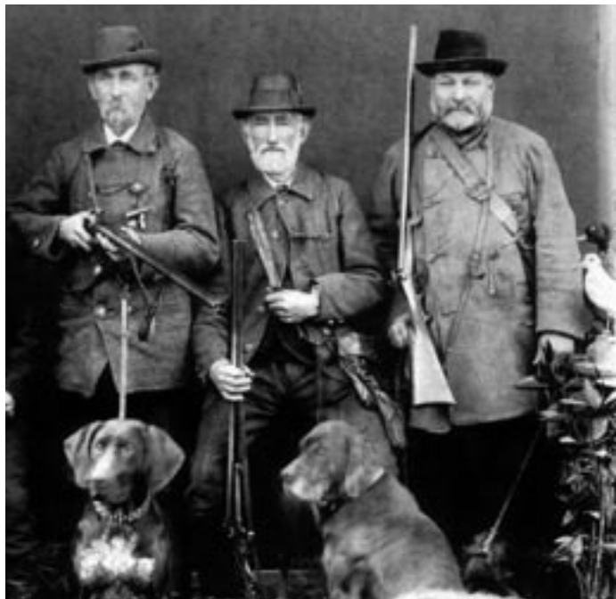
Bürgerliche Jagdgesellschaft um 1900.

lichen Jagd der Celler Herzöge in der zweiten Hälfte des 17. Jahrhunderts über die Hofjagden in der Zeit der Personalunion zwischen England und Hannover im 18. Jahrhundert bis hin zum Wandel des Jagdsystems und der Jagdmethoden seit der Mitte des 19. Jahrhunderts. Ob Hofjagd, Heckenjagd, fürstliche Prunkjagd oder Parforcejagd; ob adeliger Zeitvertreib oder Teil des Lebensunterhaltes – das vorliegende Buch stellt, auch kritisch, die verschiedensten Aspekte der Jagd vor und nimmt gleichzeitig die sozialgeschichtlichen Bezüge auf. Herausgekommen ist ein