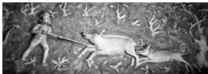
Wildschweinhatz mit der Saufeder, Stuckrelief im Schloss Wolfsburg, Foto: Martin Stöber.