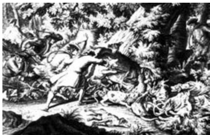
Abschluss einer Parforcejagd, Der Jagdherr setzt den Hirschfänger ein. Nach Riedinger um 1750.

Die Jagd – von Beginn an ein elementarerer Teil des menschlichen Lebens. Ihre Geschichte – ein faszinierendes Thema, nicht nur für Jäger, sondern immer mehr auch für Forschung und Wissenschaft.