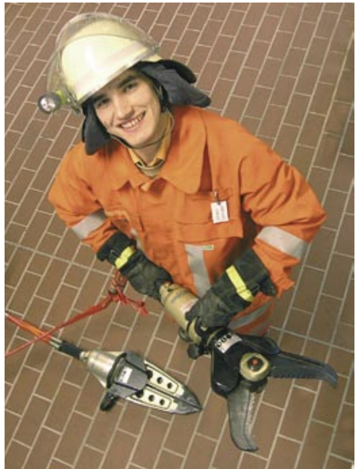
Foto: Schere und Spreizer des neuen Rettungssatz

Ebenso wie sich die Autoindustrie weiterentwickelt hatte, musste jetzt auch das Suderburger Rettungsgerät dem Stand der Technik angepasst werden. Hierzu wurde durch die Samtgemeinde ein neuer hydraulischer Rettungssatz angeschafft. Dieser besteht aus einer deutlich leistungsfähigeren Rettungsschere, einem Spreizer (zum Auf- und Auseinanderdrücken von gestauchten Fahrzeugteilen) und einem Aggregat, das die nötigen Kräfte für die hydraulischen Rettungsgeräte erzeugt. Neben einer höheren Kraftübertragung zeichnen sich die neuen Geräte vor allem durch ihre größeren Schneid- bzw.- Spreizweiten aus: damit wird auch das Durchschneiden von großen und sehr festen Fahrzeugteilen möglich.