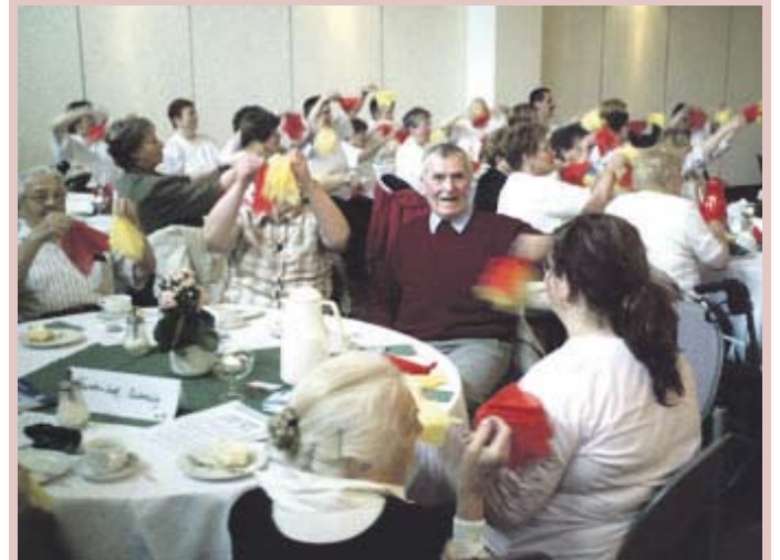
Beim gemeinsamen Sitztanz machten die Bewohner des Twietenhofes eine gute Figur. Alle waren eifrig bei der Sache und hatten ihren Spaß am bunten Programm.

miteinander umgegangen, haben gemeinsam gespielt und erzählt. Im Twietenhof ist das Auftauchen von Kindern nichts Neues, besteht doch schon seit längerem ein regelmäßiger Kontakt mit dem Suderburger Kindergarten.