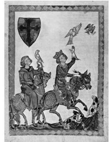
König Conradin bei der Beizjagd, 1268, Manessische Handschrift

Als Gaumenkitzel werden kostenlose Proben von Wildbret angeboten, aber auch sonst ist für eine gute Versorgung mit Speisen und Getränken gesorgt.