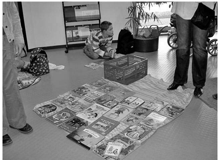
Ein reichhaltiges Angebot auf dem Bücherflohmarkt