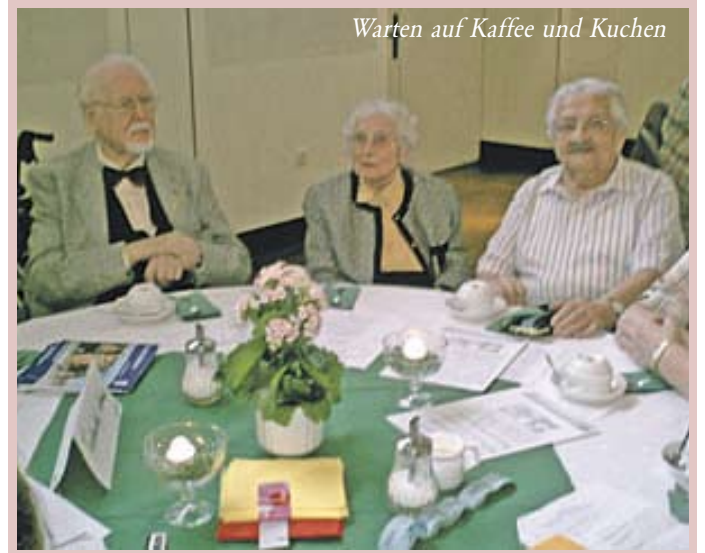
Warten auf Kaffee und Kuchen

Kaum lässt sich die Sonne am Himmel sehen, schon finden sich die Bewohner zu Spielerunden und Kaffeekränzchen auf der Terrasse des Twietenhofes ein. Kaffee und Kuchen schmecken eben an frischer Luft noch mal so gut.