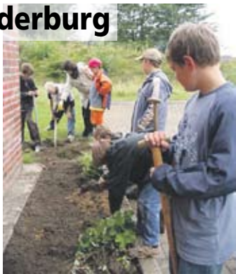
Ein Schulgarten wird angelegt.