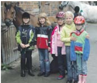
Projektgruppe a. dem Reiterhof!