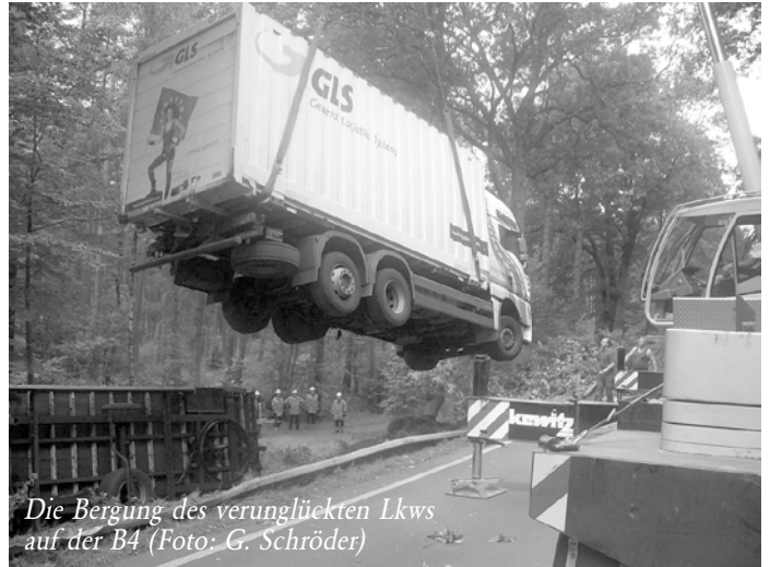
Die Bergung des verunglückten Lkws auf der B4