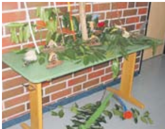
Gebasteltes aus Naturmaterialien.