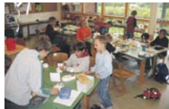
Wasseruntersuchungen im Klassenraum!