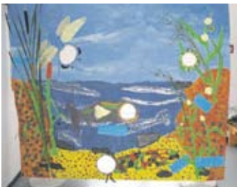
Hier kann man sich als Libelle/ Köcherfliegenlarve fotografieren lassen!