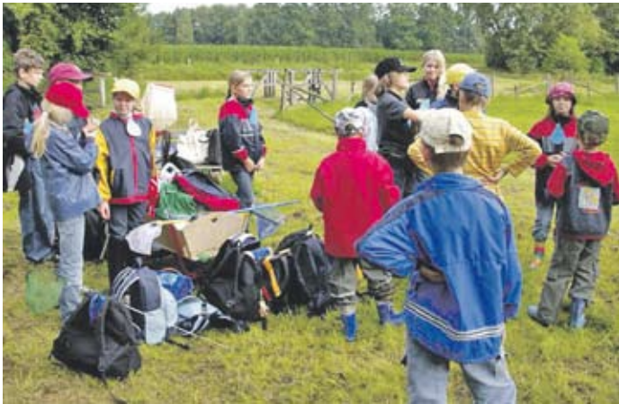
Eine Projektgruppe unterwegs