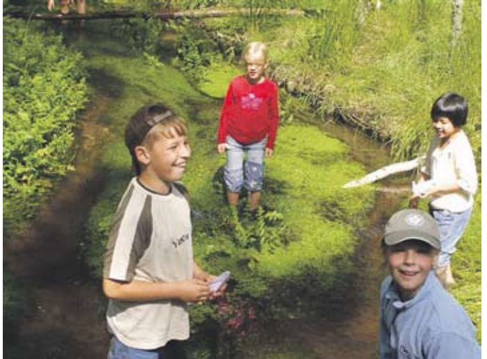
Das macht Spaß! -Wasserforscher aus der 3b-