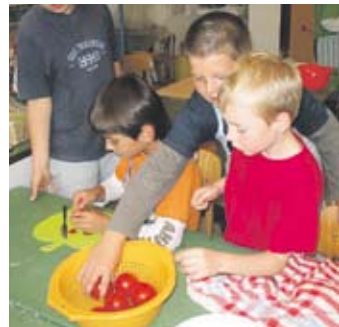
Und Jungen kochen doch gern und gut!