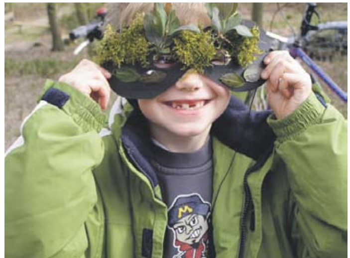
Sehe ich nicht gefährlich aus?!