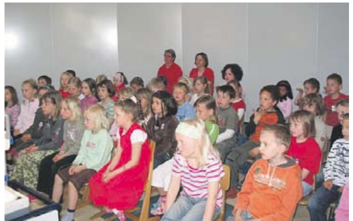
Die Kinder lauschen gebannt der Schriftstellerin!