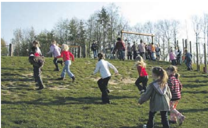
Begeistert stürmen die Schüler den neuen Spielgeräten entgegen.