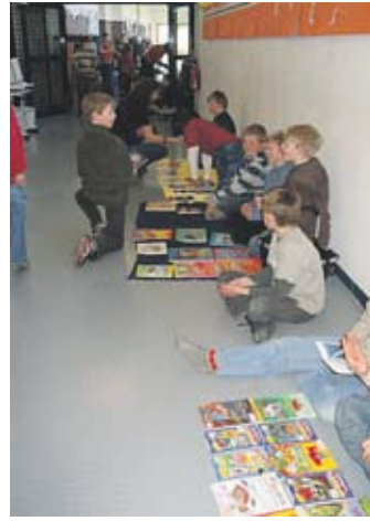
Hier darf gestöbert werden!