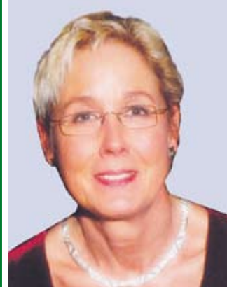
Bürgermeisterin Christel Beplate-Haarstrich

Wir laden Sie sehr herzlich dazu ein und würden uns freuen, möglichst viele Gäste an den einzelnen Festtagen begrüßen zu können.