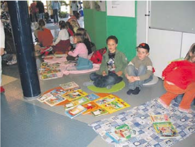
Bücherflohmarkt in der Grundschule