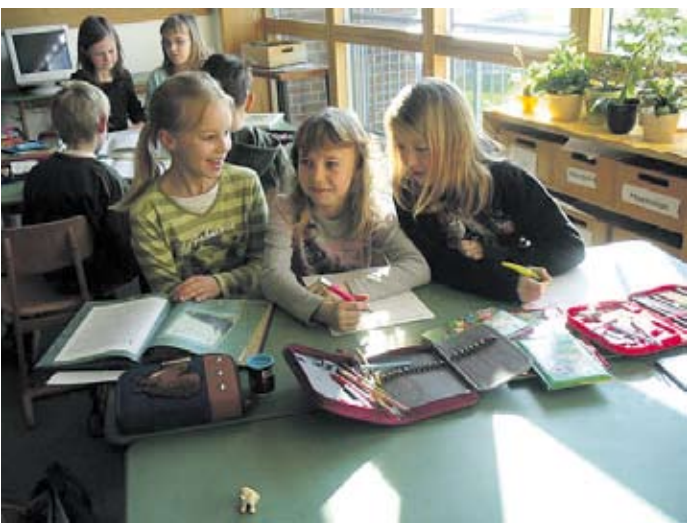
Schüler bei der Arbeit

Redaktionsschluß der nächsten Ausgabe der ZEITUNG ist der 27.6.2008, Erscheinung am 4.7.2008