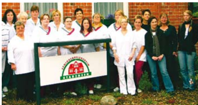
Ein Team qualifizierter Pflegekräfte steht rund um die Uhr für die Bewohner bereit.