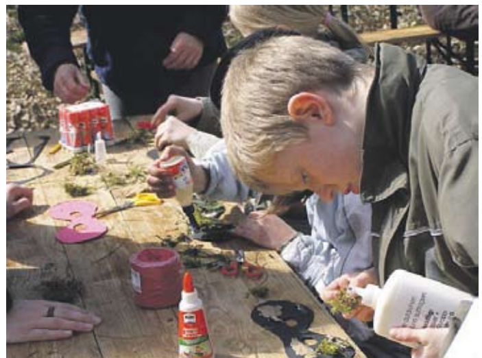
Voller Begeisterung werden z.B. Masken gebastelt, um als „Waldzorro“ aktiv werden zu können!