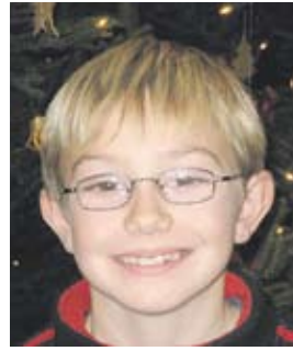
...Freude in den Familien!