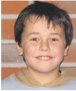
...dass Suderburg ein Schwimmbad bekommt!