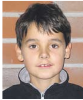
...dass jeder viel Geld bekommt!