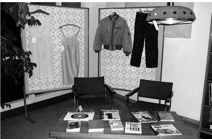
Die „Wohncke“ mit einigen kopierten Exemplaren der 68er Literatur und der Kleidung.

Wer mehr über das Thema wissen will, im „Heimatkalender 2009“ ist ein Text über die Recherche erschienen.