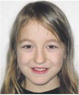
...Dankbarkeit für die Geschenke! Manche bekommen gar nichts, daran sollte man auch denken!