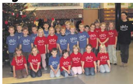
3. Preis: Klasse 2b der Grundschule Suderburg (Klassenlehrerin Frau Gröfke), 112,50 €