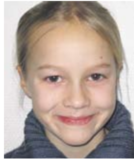
...schöne Geschenke! INGE40 044.jpg