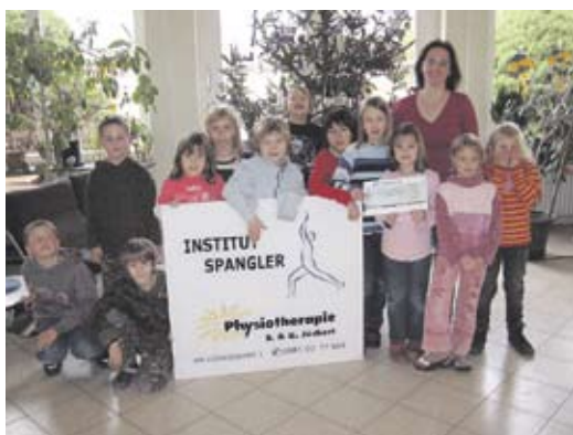
1. Preis: Klasse 4a der Grundschule Suderburg (Klassenlehrerin Frau Benter), 175,- € Krankengymnastik