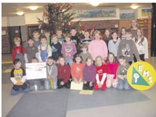
1. Preis: Klasse 2b der Grundschule Holdenstedt (Klassenlehrerin Frau Wrede), 175,- €

Die Klasse 2b der Holdenstedter Grundschule, die auch Vorjahressieger war, und die Klasse 4a der Suderburger Grundschule freuen sich gemeinsam über ihren 1. Platz im Wettbewerb „Zahlenstärkste Schulklasse“ beim Herbstlanglauf des VfL Suderburg in Hösseringen. Sie konnten ihre Klassenkasse mit jeweils 175,- € aufbessern.