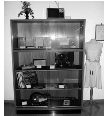
Schallplatten, Musikgeräte, Fernseher, E-Gitarre: die „Modernität“ der 68er.

Sie forderten eine Eingliederung in den Gesamthochschulbereich, verlangten u.a. eine Modernisierung der Studieninhalte und wollten ein Mitspra-