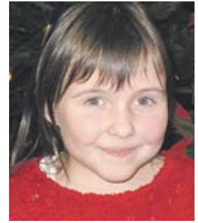
...ein neues Spielgerät für die Schule!