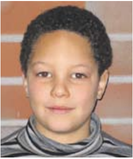
...ein neues Fußballtor für den Schulhof!