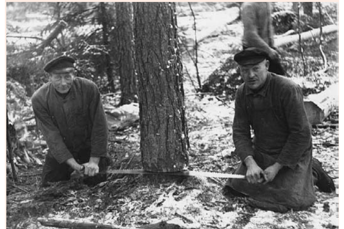
Waldarbeiter fällen eine Kiefer mit der Schrotsäge

Als erster Höhepunkt des diesjährigen Ausstellungskanons wird ab dem 5. April die Sonderausstellung „Von der Lüneburger Heide zum Lüneburger Wald“ zu sehen sein. Zu diesem Zweck hat das Museumsteam den Wald quasi ins Haus geholt. Thema der vielseitigen Schau mit zahlreichen Exponaten ist die Entwicklung des hiesigen Waldes seit dem Beginn menschlichen Einwirkens - nachweisbar ab etwa 800 vor Christus - bis heute. Unter dem Tenor „Arbeit im Walde“ wird die Waldbewirtschaftung und damit auch -veränderung anhand der Baumarten Eiche und Kiefer aufgezeigt. Während die Eiche im Wesentlichen für die alten Formen der Waldnutzung steht, ist die Kiefer zum Wahrzeichen der Heideaufforstung geworden. Wahrhaft imposant sind die ausgestellten Gerätschaften, anhand derer die Veränderungen in der Waldarbeit dokumentiert werden.