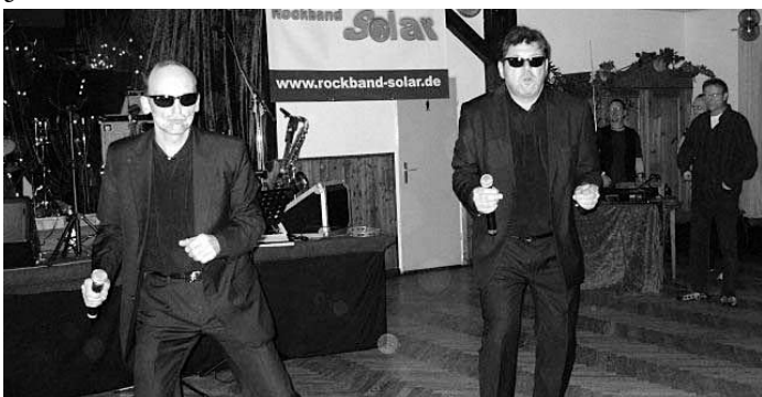
Brachten Schwung ins Publikum, die „Men in Black“

Wer den Abend verpasst hat, was doch recht viele waren, der sollte sich zukünftig doch einmal vom Sofa lösen, wenn bei Pucks eine Party steigt.