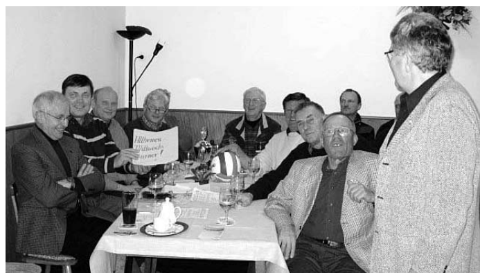
Die Mittwochs-Männer-Turner, Mannschaft des Jahres