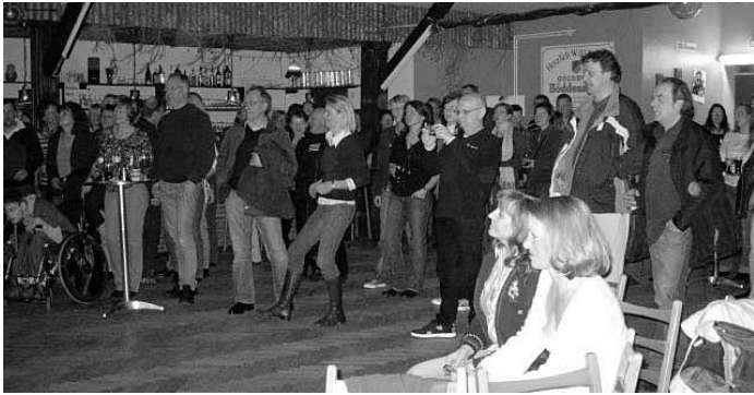
Begeistertes Publikum beim Rock bei Puck