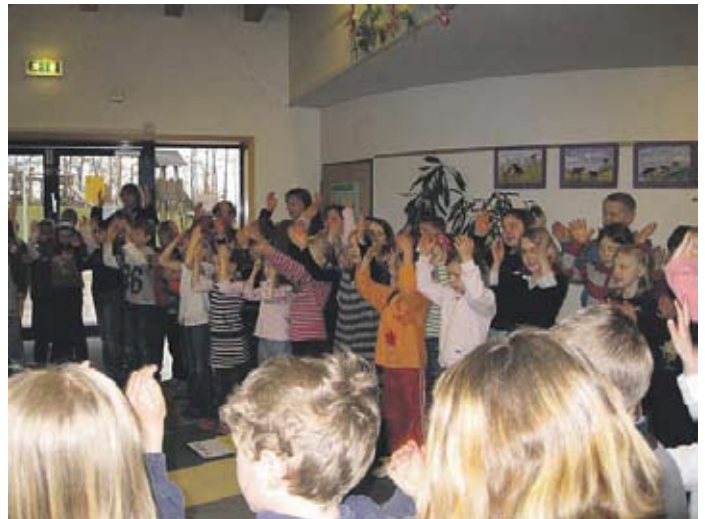
Voller Inbrunst wird der Frühling gebeten, endlich Einzug zu halten!