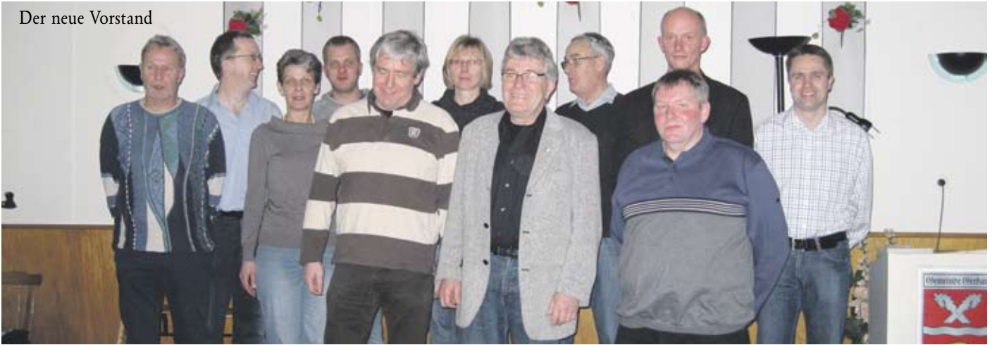
Der neue Vorstand