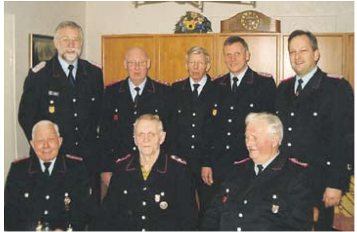
Geehrte, Beförderte und Neuaufnahmen, zusammen mit dem Kommando der Wehr