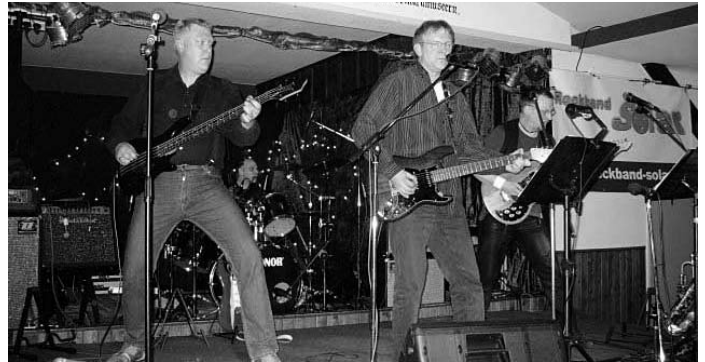
Solar rockt mit neuem Bassisten