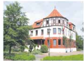
Corporationshaus der Erica

Burschenschaft Erica zu Suderburg im DDG An der Kirche 5, 29556 Suderburg Tel. 058250280, Fax: 058268330 E-Mail: aktiva@b-erica.de