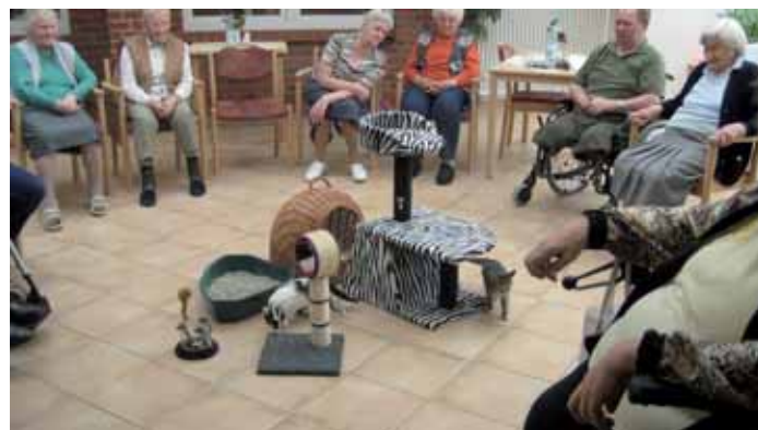
Alle schauen den Neuankömmlingen zu, für die beiden Kätzchen ist alles vorbereitet.

Das Damen-bzw. Herrenfrühstück findet seit kurzem regelmäßig 1x/Monat statt und ist bei den Bewohnern/innen sehr beliebt. Hier werden ihre besonderen Wünsche für ein festliches Frühstück gern erfüllt. Man sitzt gemütlich in großer Runde an einem festlich oder themenorientiert geschmückten Tisch, schlemmt und klönt. Da gibt es schon mal Lachs und Forelle, deftige Leberwurst und Thüringer Mett oder auch viel frisches Obst, lecker angerichtet!