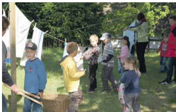
Wenn die Wäsche dann im Wind flattert, ist die schwere Arbeit des Waschtages beendet.