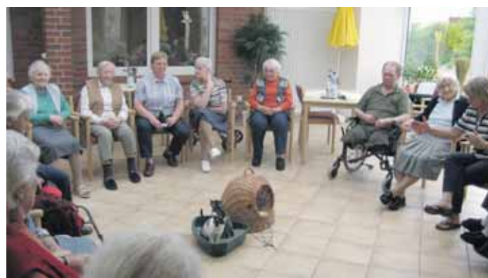
Einzugstag im Twietenhof: Das Katzenklo wird gleich im Duett eingeweiht!