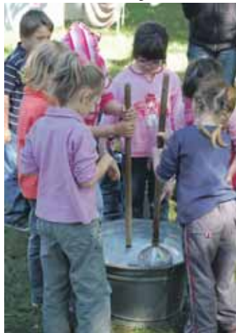
Mit Wäschestampfern wird die Wäsche in der Lauge bewegt und so gereinigt.

Hösseringen. 31 zukünftige Schulkinder des DRK-Kinder Gartens Suderburg besuchten mit ihren Betreuerinnen das Museumsdorf Hösseringen. „Wäsche