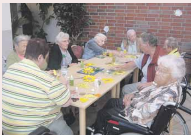
... und alle sind wieder mit Freude bei der Sache.