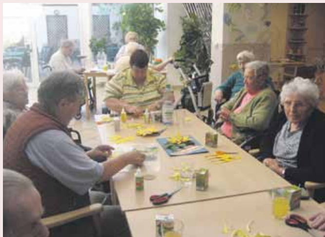
Außerdem werden zur Zeit regelmässig Äpfel geschält und zu Apfelmus, Kuchen, Apfelschmalz und Kompott verarbeitet.