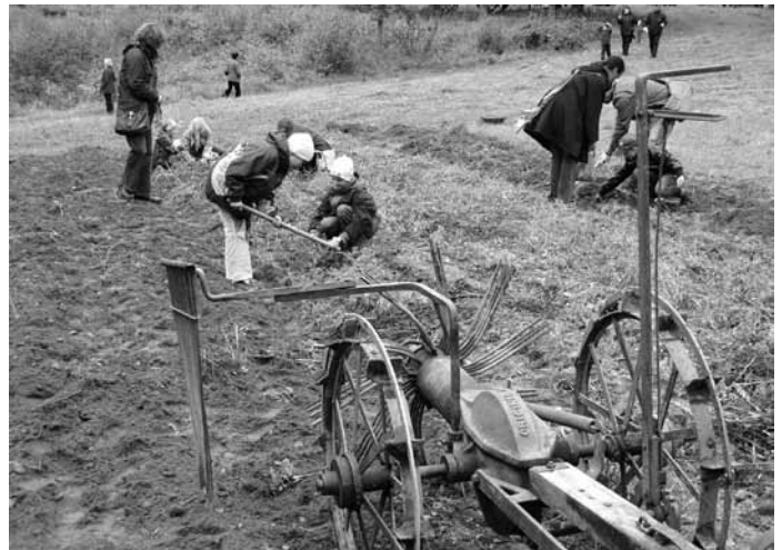
Fotos: Kartoffelernte auf dem Acker des Museumsdorfes

durch das Bundesministerium für Ernährung, Landwirtschaft und Verbraucherschutz, wird im Haus aus Oldendorf gezeigt.