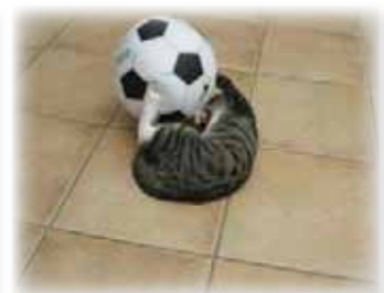
Fritz hingegen greift gleich richtig an. Es wäre doch gelacht, wenn man diesen Ball nicht kaputt kriegen würde!