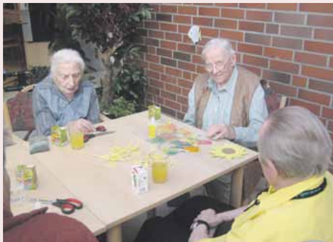
Die Bewohner basteln herbstliche Dekoration (Sonnenblumen) für das bevorstehende Herbstfest...