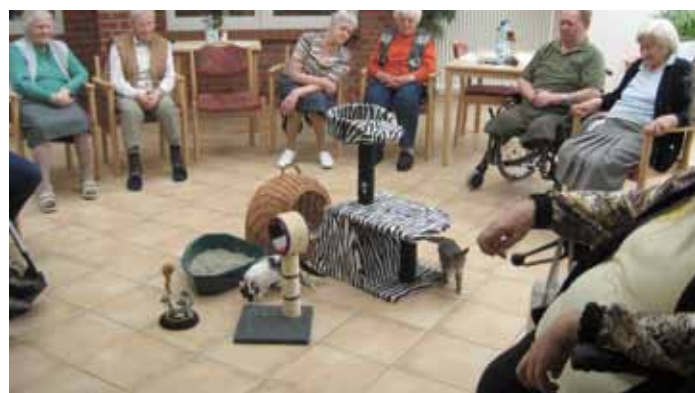
Die Bewohner beobachten das Geschehen mit Interesse und Freude.

Mit Beginn des Septembers geht der Sommer so langsam seinem Ende entgegen. Im Twietenhof laufen bereits die Vorbe-