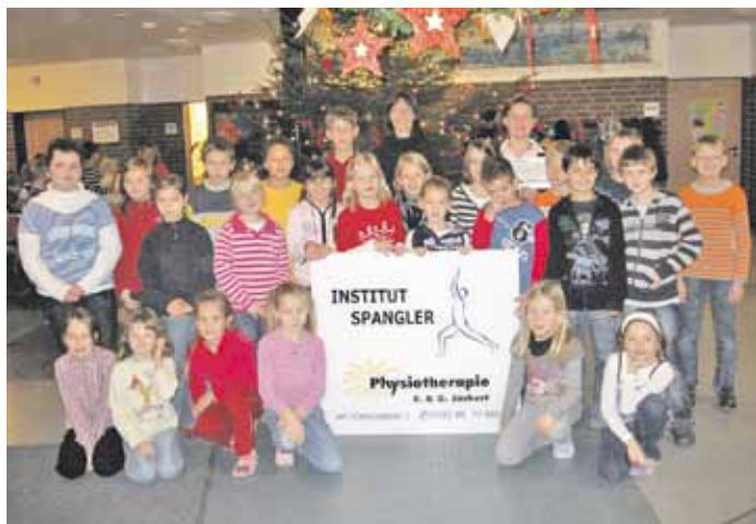
1. Preis: Klasse 3b der Grundschule Holdenstedt (Klassenlehrerin Frau Wrede), 200,- €