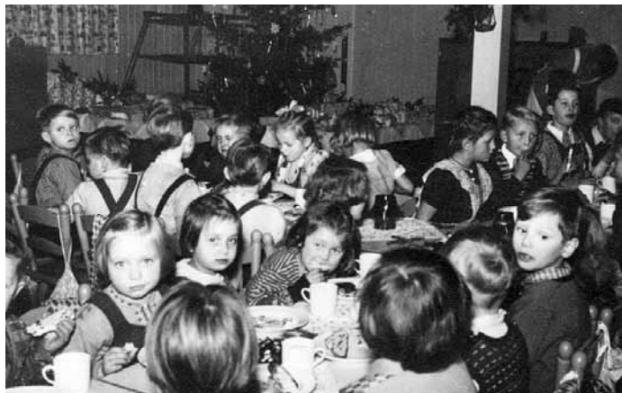
Flüchtlingskinder bei Weihnachtsfeier

Die Weihnachtszeit bedeutete hinsichtlich der Betreuungsarbeit sicherlich eine besondere Herausforderung. Es mussten zusätzlich Mittel aufgebracht werden, um die Flüchtlinge in Form von besonderen Mahlzeiten und kleinen Geschenken am Weihnachtsfest teilhaben zu lassen. Noch wichtiger als die materielle Unterstützung war aber die Zuwendung, die die Zuwanderer erhalten sollten. Denn die Übersiedlung in den Westen bedeutete für die Meisten nicht nur den Schritt in eine ungewisse Zukunft, sondern die Trennung von Familie und Freunden. Deshalb sollte mit Hilfe von Advents- und Weihnachtsfeiern ein wenig Abwechslung geschafft und für eine angenehme Atmosphäre gesorgt werden, die gerade in dieser Zeit besonders wichtig ist.