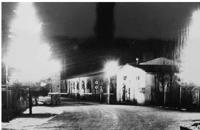
Nachtaufnahme mit Tannenbaum