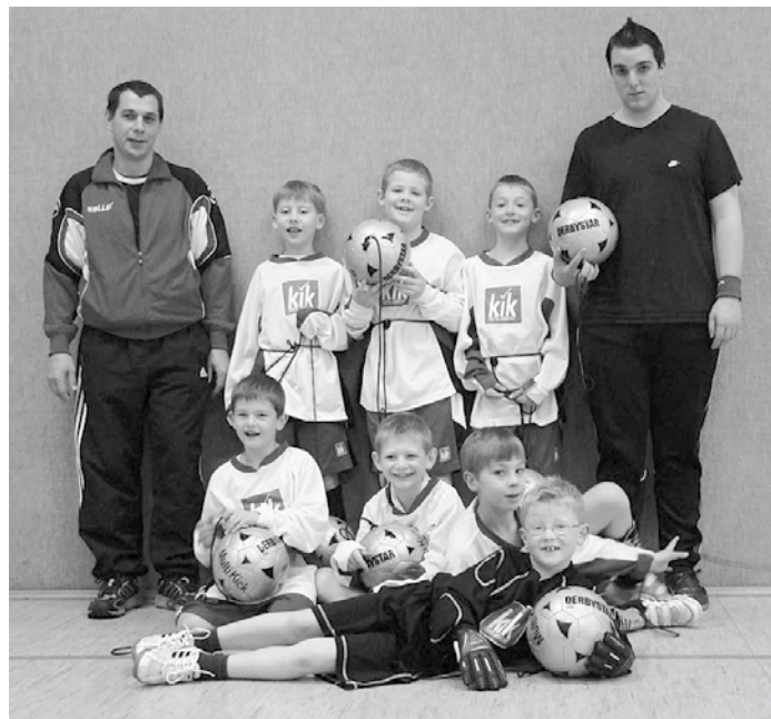
Die Mannschaft der 2. F-Jugend bedankt sich recht herzlich bei allen Spendern!

Ein großes Dankeschön geht außerdem an die Fa. KIK - Suderburg, für die Ausrüstung der Mannschaft mit einem kompletten Trikotsatz. Ein weiterer Satz Trikots wurde der E-Jugend des VfL Suderburg zur Verfügung gestellt.