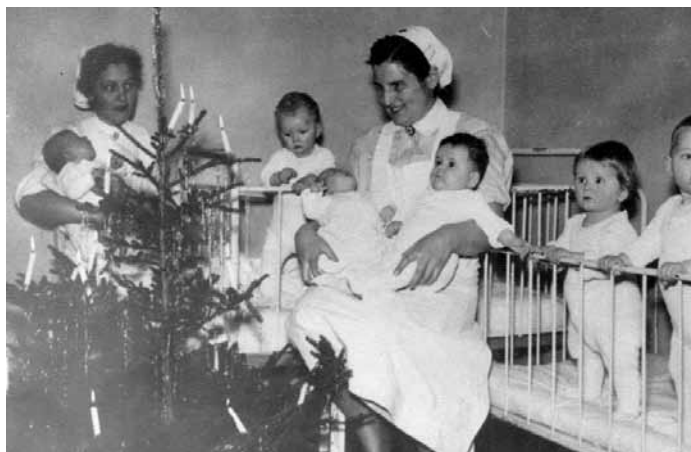
Weihnachten in der Säuglingsbaracke