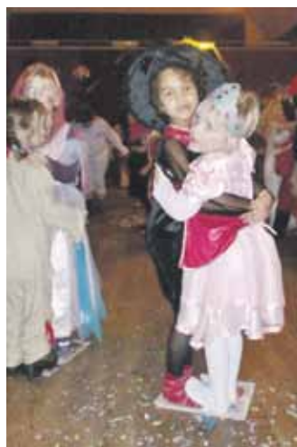
...als auch beim Zeitungstanz gekuschelt!

Luftballontanz, Luftballontreten oder Stopptanz, hatten die jungen Närrinnen und Narren jede Menge Spaß. Das abwechslungsreiche Programm der VfLer lies keine Langeweile aufkommen. Die kleinen Gäste wurden von einer Piratencrew versorgt und es gab so manchen Schatz zu finden oder zu gewinnen. Ein weiterer Höhepunkt des Nachmittags war der Auftritt der Jazztanzgruppe Delight bei welchem sowohl die Prinzessinnen als auch die Cowboys staunten. Da so ausgelassenes Feiern sehr anstrengend sein kann, sorgte die Jazzgruppe auch für die Versorgung mit Kaffee, Kuchen, Würstchen und kalten Getränken.