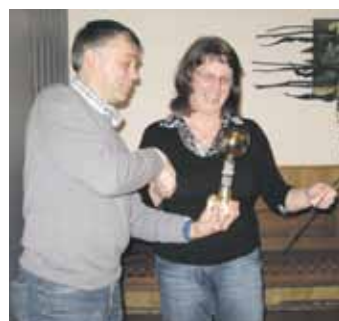
oben: Sportlerin des Jahres links: Sportabzeichenverleihung Erwachsene