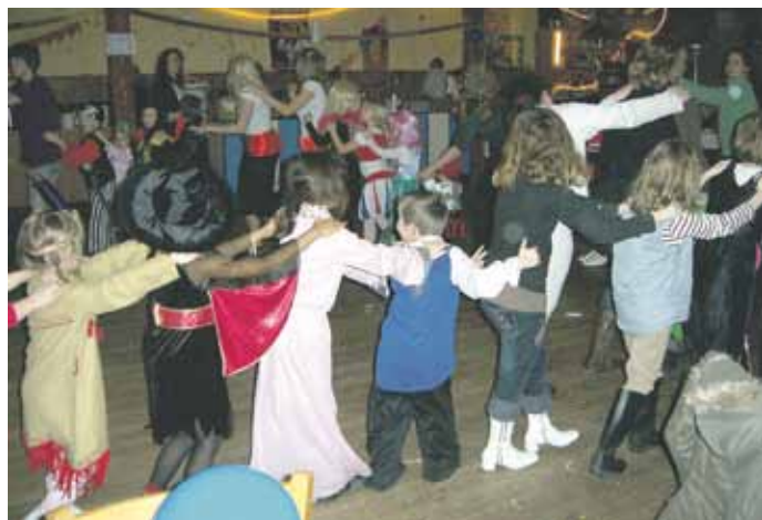
Beendet wurde das Faschingsfest mit einer Bolognese!