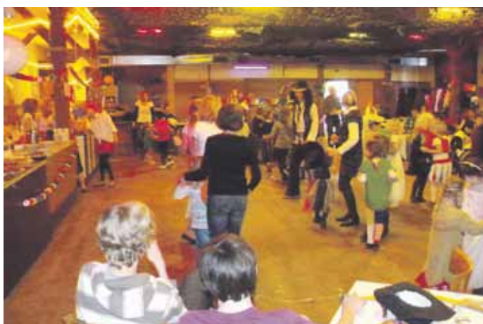
Es wurde sowohl beim Luftballontanz...

Suderburg. Einen närrischen Nachmittag erleben gut 100 Kinder und Eltern beim Suderburger Kinderfasching in der Narrenzeit. Mit lustigen Spielen, viel Tanz und Musik sorgte der VfL Suderburg für eine Riesengaudi. Beim