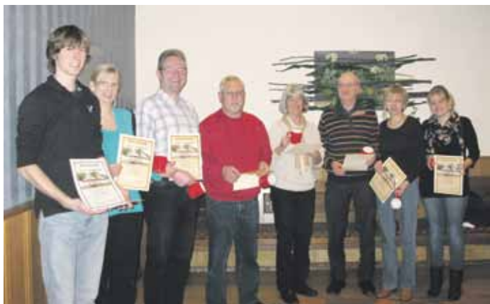
Ehrung für 15 Jahre Mitgliedschaft