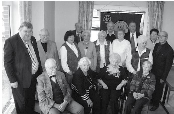
Das Bild zeigt den Vorstand und die Geehrten.