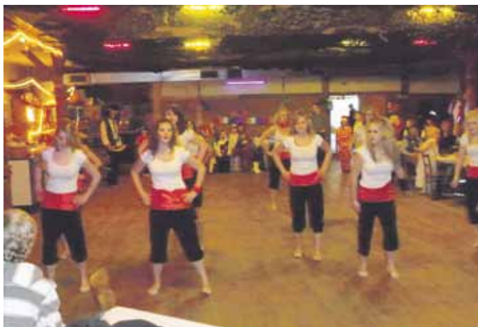
Die Jazztanzgruppe Delight!