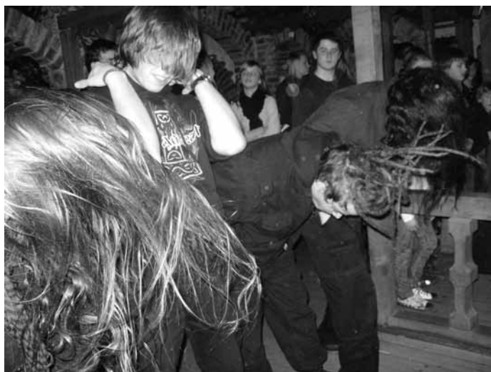
So sieht „headbanging“ aus ...

„Called to Mind“ beginnt mit ihrem ansprechenden Wechsel von melodisch ruhigen und