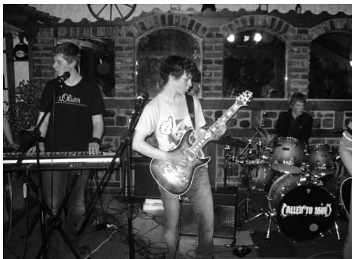
... und rockt ...