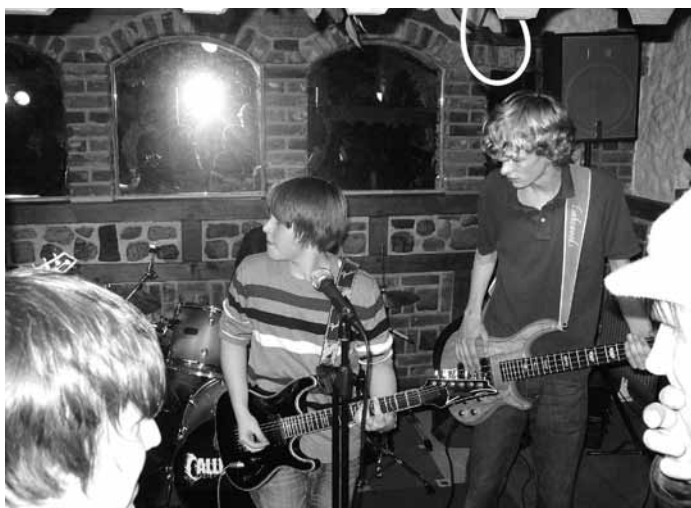
Limit rockt ...