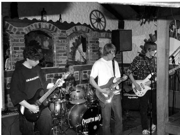
Called to Mind „am Start“