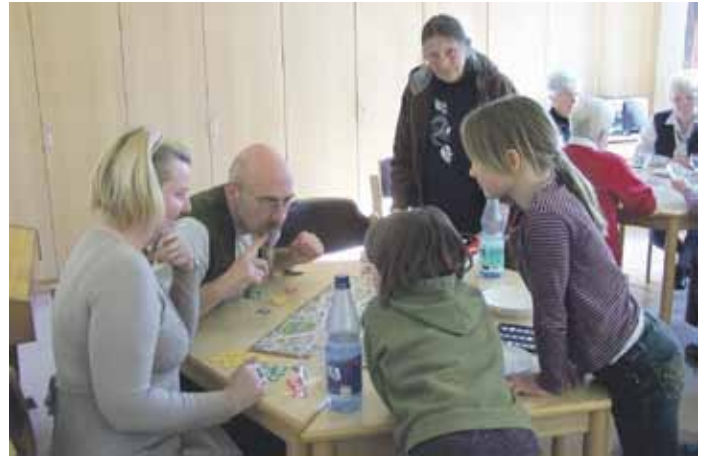
Gemeinsam spielen - Spannung pur bei „Scotland Yard“!