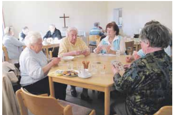
Ein Vergnügen - Kartenspielen in großer Runde.

und kleinen Knabbereien kam es zu vielen angeregten Gesprächen. Zum Schluss waren sich alle einig: „Das hat Spaß gemacht - wir kommen wieder!“ Der nächste Termin steht schon fest: am 27. Mai 2010 geht es in die 2. Runde. Der DRK Spiele-Nachmittag soll in Zukunft regelmäßig stattfinden. Geplant ist ein Termin im Monat - jeweils donnerstags von 15:00 bis 17:00 Uhr im Gemeindehaus in Eimke. Jeder Teilnehmer ist herzlich willkommen! Geplant sind fröhliche Spiele-Nachmittage für Groß und Klein von 0-99 Jahre. Komm - und spiel mit!