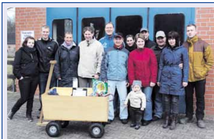
Eine wettertechnische Punktlandung haben die Brandschützer der Wichtenbecker