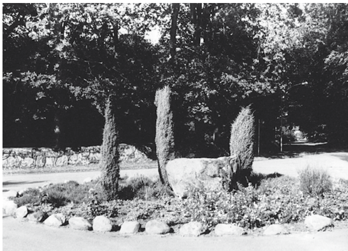
Rondell in der Brambosteler Ortsmitte

Weitere Vorträge zum Gerdaual werden im Laufe des Jahres im Bohlser Speicher veranstaltet und rechtzeitig angekündigt.