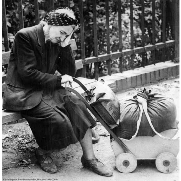
Flüchtlingsnot.

Neben der Darstellung der Entwicklung vom Durchgangslager für Vertriebene zum Notaufnahmelager für DDR-Zuwanderer soll vor allem der Weg des Zuwanderers von der Antragstel-