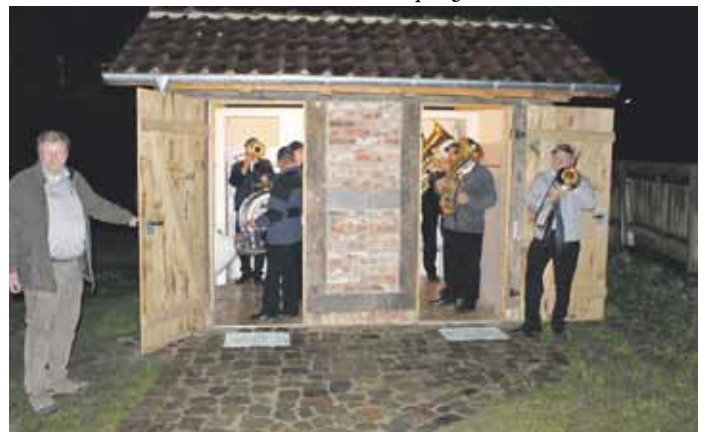
Kapelle Wahnsinn weiht mit Pauken und Trompeten das „stille Örtchen“ ein

Mit dem neuen Klohäuschen kann der Speicher nun zukünftig noch besser für Veranstaltungen in Bohlsen genutzt werden und noch stärker zu einem Ort der Kommunikation und Brauchtumpflege in Bohlsen werden.