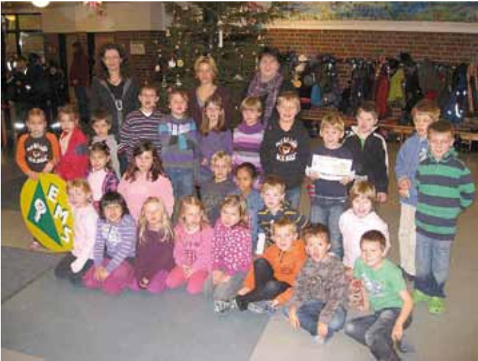
Sind wir sportlich? Ja! Klasse 1a bei der Preisübergabe des Herbstlanglaufes.