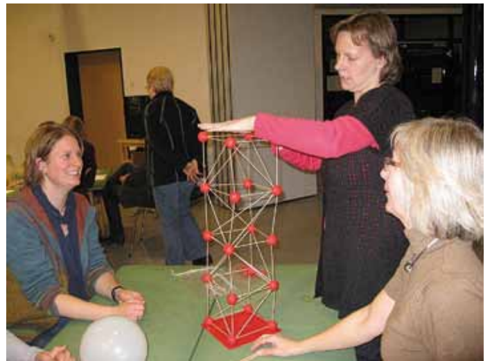
Wenn das nicht gut aussieht!