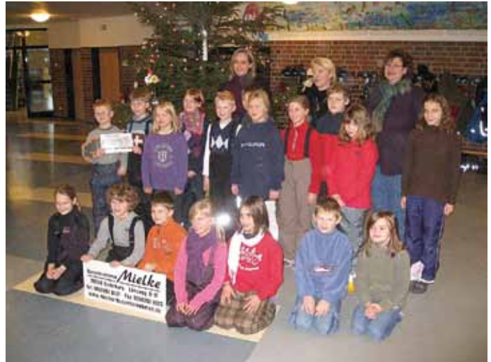
Auch die Klasse 3a gehört zu den Gewinnern des Herbstlanglaufes.