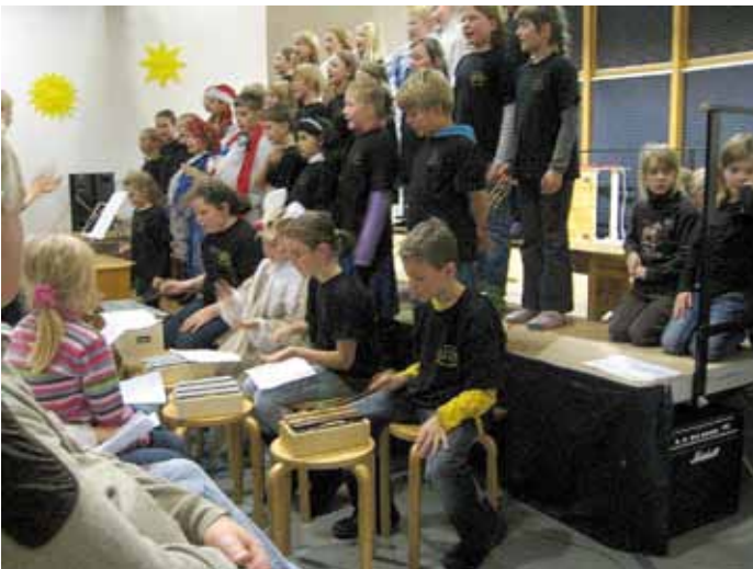
Beim musikalischen Abschluss wirkten alle mit!