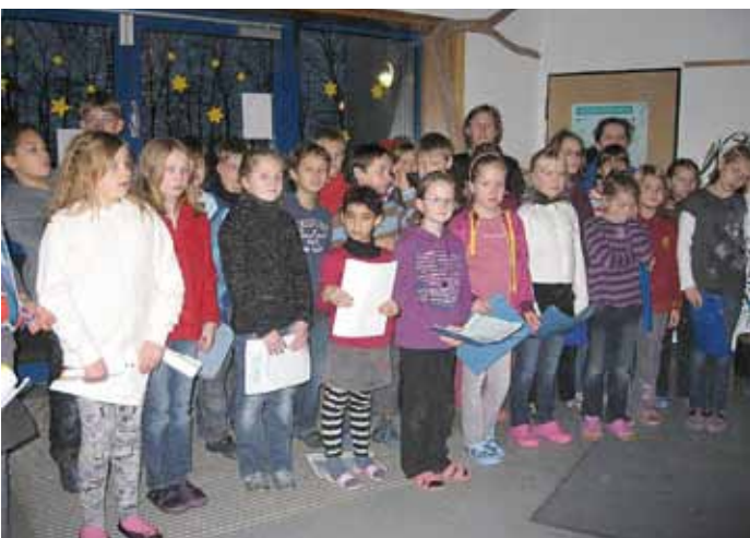
Adventsingens in der Grundschule Suderburg.