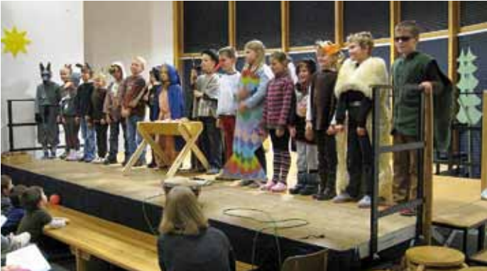
Was die Tieren dachten, als sie an der Krippe standen, präsentierte die Klasse 2b.