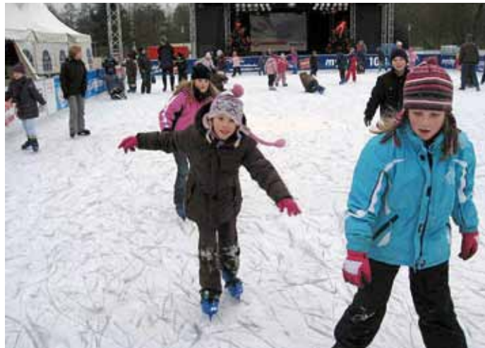
Eislaufen ist schwieriger als es aussieht!

Ebenfalls die Idee einer Mutter war es, eine Nachtwächterwanderung für unsere dritten und vierten Klassen zu organisieren. Der Erfolg hat alle überrascht, wir hatten über 80 (!) Anmeldungen und auch dieser Abend in Uelzen war großartig!