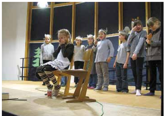
Die Weihnachtsmaus knabbert alles an...ist die Mutter verzweifelt?