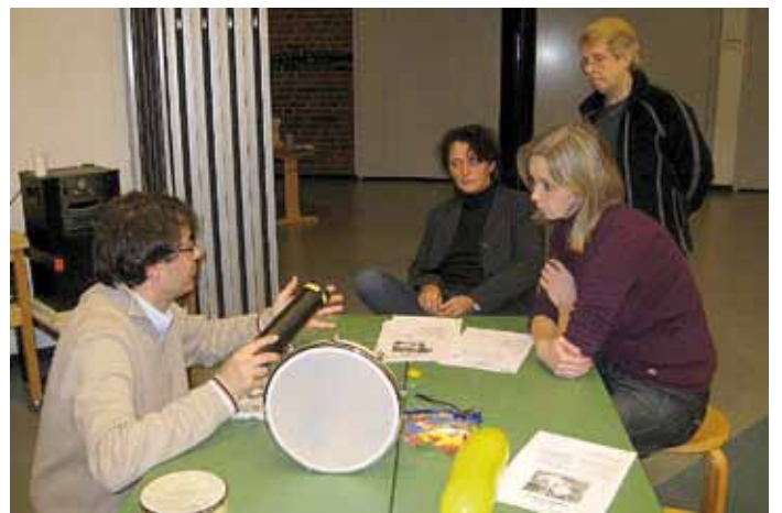
Skeptische Blicke treffen den Referenten. Wenn das mal so stimmt, was er erzählt!