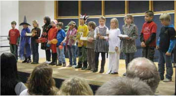
Wie in anderen Ländern Weihnachten gefeiert wird, präsentierten die Kinder aus der Klasse 3b.