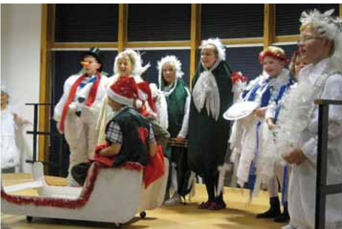
Auch einen Ausflug ins „Winterwonderland“ gab es in der Grundschule.