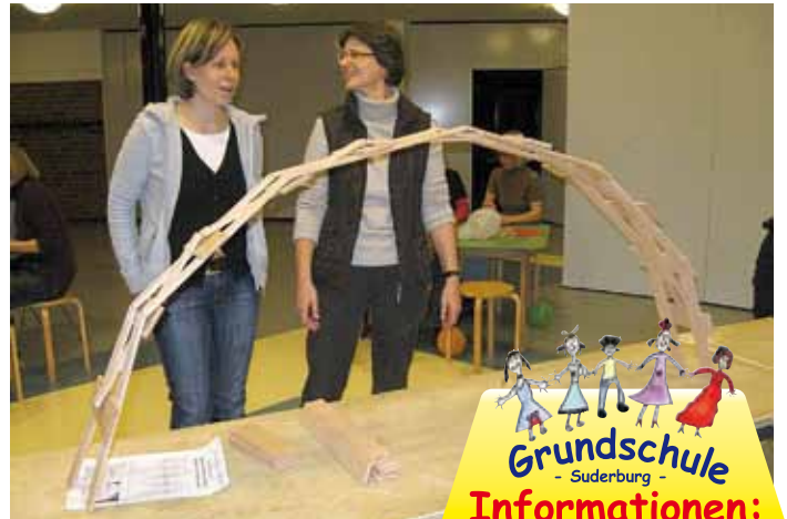
Während einer Fortbildung übten Eltern und Lehrerinnen das gemeinsame Brückenbauen.

Wir bedanken uns für die gute Zusammenarbeit im zurückliegenden Jahr!