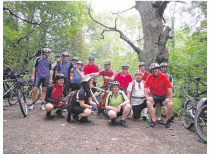
Am ältesten Baum Berlins

Im Stadtteil Kreuzberg bekamen wir Einblicke in eine für uns fremde kulturelle Vielfalt. Das sommerliche Wetter hat an diesem Wochenende viele Kreuzberger Bewohner in die öffentlichen Anlagen getrieben. Die Fahrt durch den Görlitzer Park hat einen bleibenden Eindruck hinterlassen.