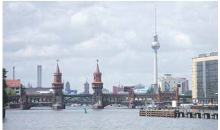
Die Spree mit Blick Richtung Centrum