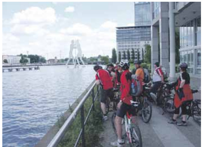
Auf dem Weg nach Köpenick