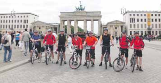
Vor dem Brandenburger Tor