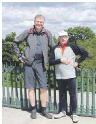
Der Grösste und der Älteste