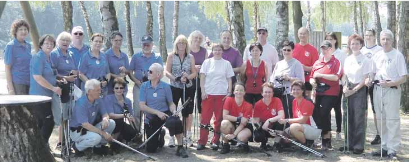
Die Teilnehmer der langen Nordic Walking Tour.