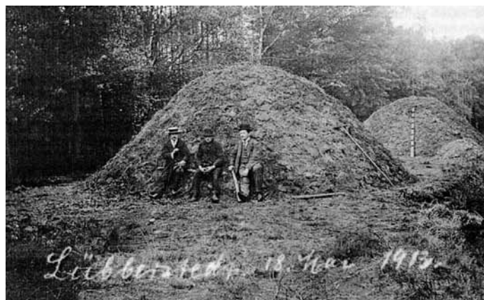
Zwei bereits abgedeckte Meiler in Lübberstedt am 18. Mai 1913, Aus: Rolf Hillmer, Köhler in der Lüneburger Heide, Suderburg 1999

Inzwischen ist die alte Arbeitsweise in Vergessenheit geraten. Studenten der Universität Kiel, Fachbereich Ur- und Frühgeschichte, möchten ihr nun wieder auf die Spur kommen - im Museumsdorf Hösseringen. Sie werden unter Anleitung von Dr. Arne Paysen einen Meiler aus Birkenholz aufsetzen, in dem Holzkohle hergestellt wird. Je nach Witterung und Größe steht ein Meiler ein bis sechs Wochen lang in Glut - da heißt es Tag und Nacht achtgeben, dass das Holz nicht verbrennt und dass kein Feuer ausbricht. So wie in der Raubkammer bei Munster, wo im Juli 1899, als der Köhler beim Aufsuchen eines zweiten 300 Meter entfernten Meilers den ersten aus den Augen verlor und dieser den angrenzenden