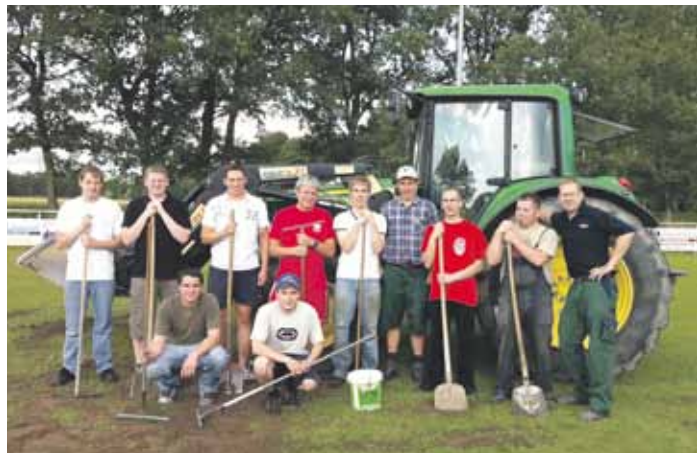
Am 08. und 09.07.2011 trafen sich die Fußballer der 1. Mannschaft des MTV Gerdau zu einem Arbeitseinsatz auf dem Sportplatz, um das Spielfeld für die neue Saison zu renovieren. Die unebenen Flächen wurden mit Mutterboden gefüllt und neu angesät.