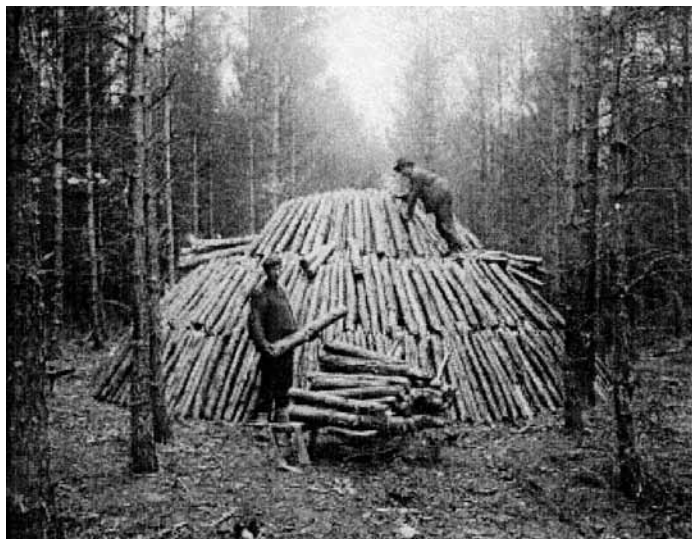
Aufschichten eines Meilers im Klosterforst Niebeck.