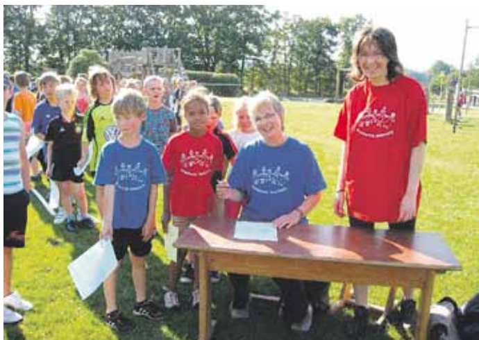
Die Stimmung war gut bei den Bundesjugendspielen!

Eine ganze Woche lang waren die Klassenverbände aufgelöst, klassenübergreifende Gruppen wurden gebildet und die Kinder durften an vielen attraktiven Stationen ihre körperliche Fitness beweisen. Was sie auch begeistert taten. Außerdem gab es viele Stationen, in denen alte Kinderspiele unseren Schülerinnen und Schülern wieder vertraut gemacht wurden. Es wurde beim Gummitwist gehüpft, Sackhüpfen und Tauziehen standen ebenso auf dem Stundenplan wie z.B. Hinkelkästchen und Stelzenlauf. Außerdem hatten die Kinder die Gelegenheit, Spielzeuge selbst herzustellen. So konnten Jon-