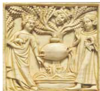
Relief: Tristan und Isolde beim heimlichen Treffen, beobachtet von König Marke im Baum, um 1340, heute im Louvre.

In ihrer musikalischen Lesung wollen Christine Kohnke und Jan Kukureit den Bogen schlagen vom keltischen Sagenkreis über die geistliche Welt des Klosters bis hin zur modernen Kinofassung - all dies anhand der Geschichte von Tristan und Isolde.