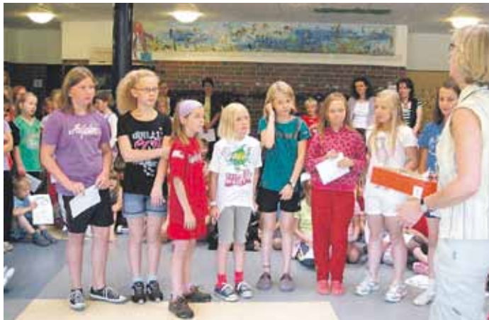
Urkunden für die Fußballerinnen der Grundschule.