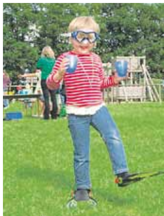
Das ist wirklich schwierig, so zu laufen!!