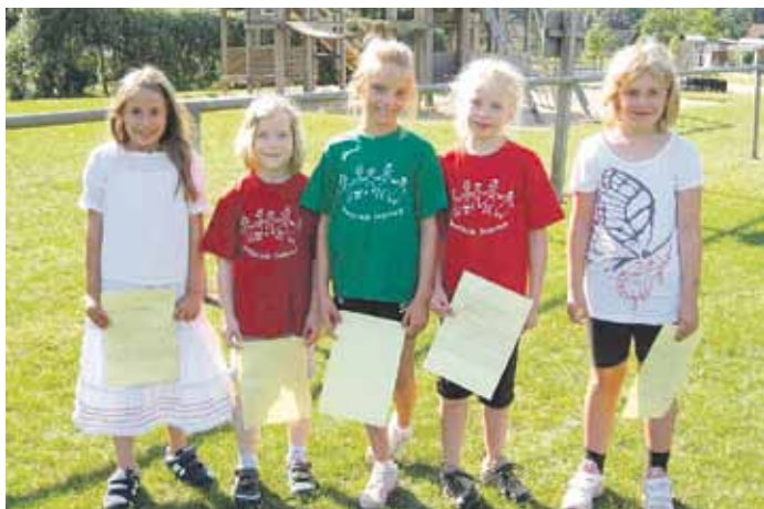
Bundesjugendspiele: Sportliche Mädchen!