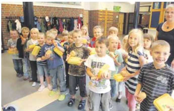
Die beiden ersten Klassen bekommen Bio-Brotboxen als Geschenk!

Die vierten Klassen haben sich mit Liedern und Vorführungen verabschiedet, es wurden Bonbons geworfen und die Stimmung war eine Mischung aus Wehmut und großer Vorfreude. Wir wünschen den jetzigen Fünftklässlern viel Glück an den weiterführenden Schulen und sagen „Herzlich Willkommen!“ zu all denen, die wir in diesem Jahr an der Schule unterrichten dürfen!