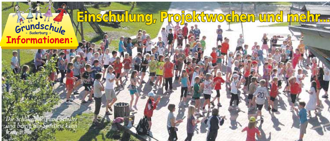
Die Schülerinnen und Schüler sind bereit, das Sportfest kann starten...

Es war bereits die zehnte Einschulungsveranstaltung, die am 20. August in der Grundschule Suderburg stattgefunden hat. Wie in den vorausgehenden Jahren begann der Vormittag für 36 aufgeregte Erstklässler mit einem liebevoll gestalteten Gottesdienst in der Suderburger Kirche. Im Anschluss ging es mit einer großen Gästeschar in die