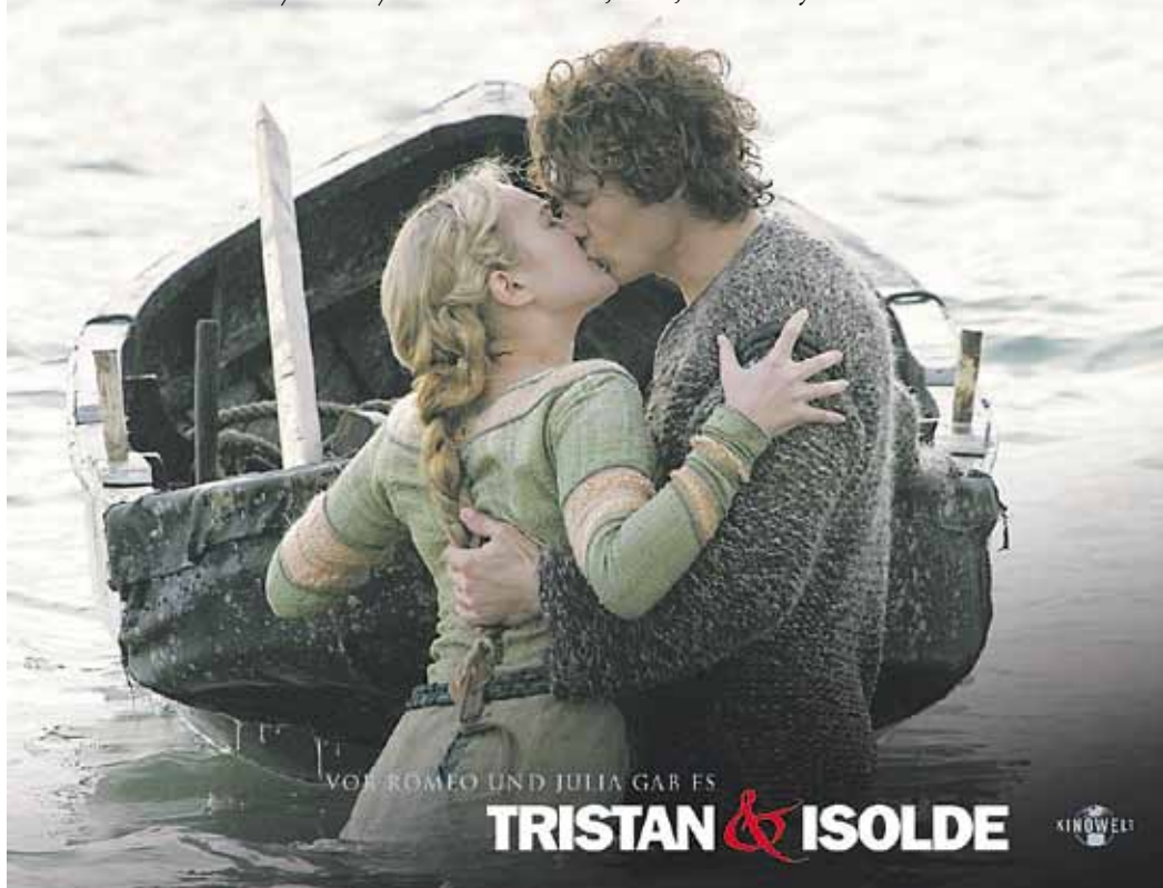
Motiv aus dem deutsch/britisch/tschechischen Film, 2005, von Ridley Scott

Wir nehmen gerne weitere allgemein wichtige Rufnummern in diesem Verzeichnis auf!