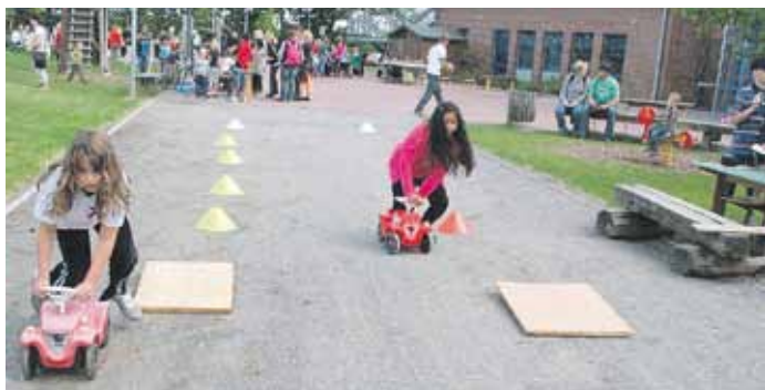
Bobbycar-Rennen auf dem Schulfest: Das macht immer Spaß!

uns das Thema „gesunde Ernährung“ schwer machte. Wir hatten trotzdem eine großartige Projektwoche, bei wunderbarem Sommerwetter gekrönt von einem gelungenen Schulfest.