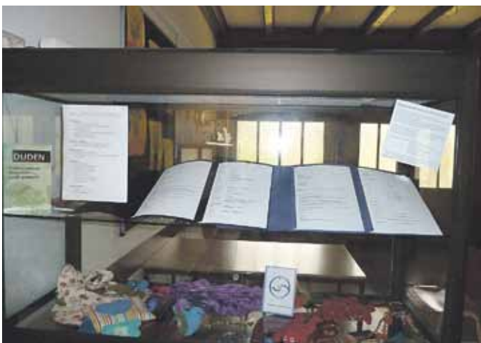
Unsere Vitrine in der Eingangshalle

Die Schüler und Schülerinnen suchten sich eine reale Stellenanzeige und schrieben eine passende Bewerbung mit allen dazugehörigen Unterlagen.