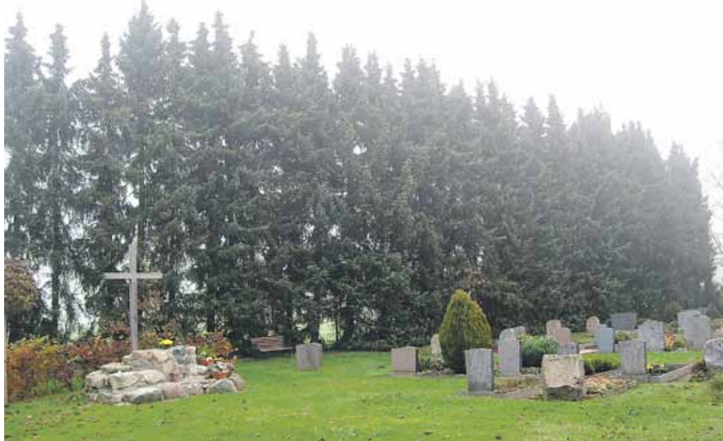
Diese Tannenreihe soll durch eine Hecke mit einheimischen Sträuchern und Bäumen ersetzt werden.