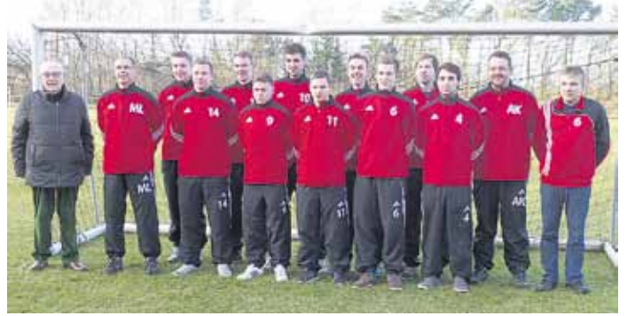
Nach dem Aufstieg in die Bezirksliga hat die 1. Herrenmannschaft des VfL Suderburg neue Präsentationsanzüge erhalten.

Um 21:50 Uhr wurde die diesjährige Versammlung geschlossen.