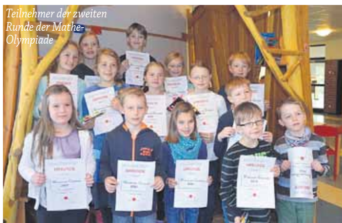
Teilnehmer der zweiten Runde der Mathe- Olympiade

Nun bleibt uns noch, allen Suderburger Bürgern und natürlich besonders den Kindern wunderbare Ostertage zu wünschen!