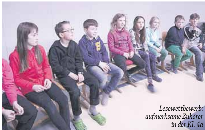
Lesewettbewerb: aufmerksame Zuhörer in der Kl. 4a