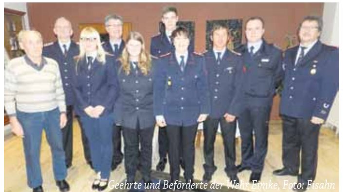
Geehrte und Beförderte der Wehr Eimke