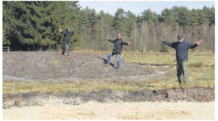
„Komische Vögel“ im neuen NABU Biotop. (Bernhard Witte)

Bei Gefahr bietet der Erdhügel den Weidetieren die Möglichkeit, eine sichere erhöhte Position im Weideland aufzusuchen, um sich im Verband möglichen Wolfsattacken zu stellen. Vergleichbar mit einer Ritterburg im Mittelalter, dient die Klauenburg den Rindern als Rückzugort in abgelegenen Weide-