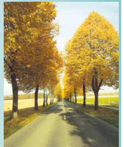
Nun dauert es nicht mehr lange, bis sie wieder ihr Laubkleid angelegt hat.

unserer Besucher und Gäste und für uns alle und die Förderung unseres Wohlbefindens. Frohe Ostern!